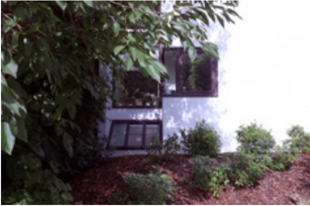
AFB. 6A Beeldreportage van woningen en residentiële gehelen in het Brussels Hoofdstedelijk Gewest uit de periode 1975-2000. Directoirelaan nr. 44 in Ukkel.