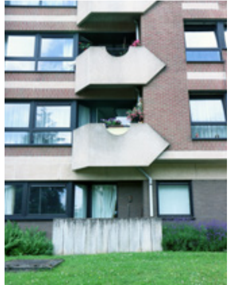
AFB. 6D Jan Olieslagerslaan nr. 13 in Sint-Pieters-Woluwe.