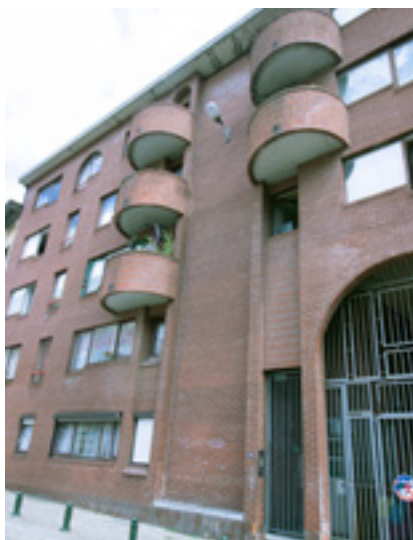
AFB. 6I Montserratstraat nrs. 42-48 in Brussel.