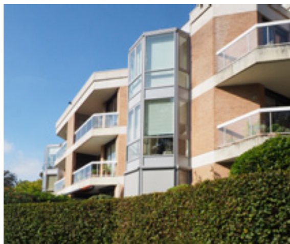
AFB. 6K Van Beverlaan nrs. 1-3-5 in Ukkel.