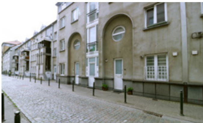
AFB. 6J Sint-Maartenstraat nrs. 15-17-19 in Sint-Jans-Molenbeek.