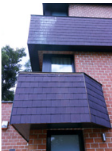
AFB. 6H Mistrallaan nr. 23 in Sint-Lambrechts Woluwe.