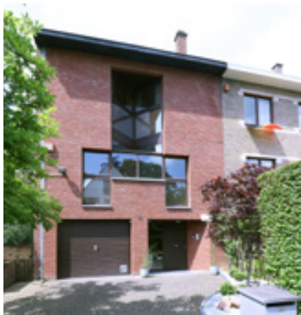
AFB. 6G Kaatsspellaan nr. 50 in Sint-Pieters-Woluwe.