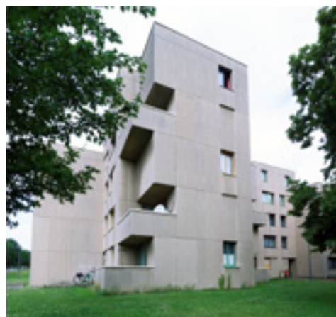
AFB. 6L Versailleslaan nr. 150 in Brussel.