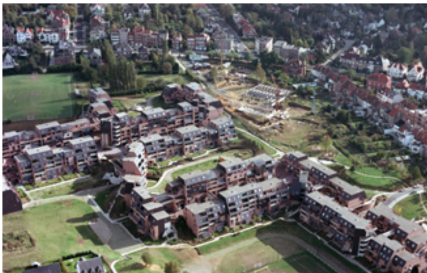
AFB. 2 In de laatste decennia van de 20ste eeuw werden verschillende sociale huisvestingsprojecten gerealiseerd volgens nieuwe stedenbouwkundige modellen, zoals De Drevekens in Sint-Pieters-Woluwe, naar het ontwerp van Group AUSIA (1974-1977).