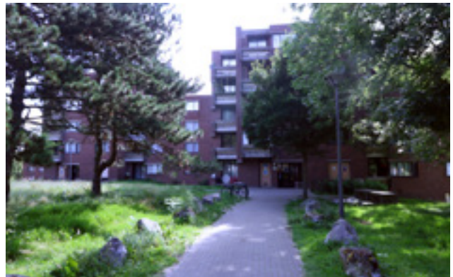
AFB. 6E Japanse Torenstraat nrs. 9-11 in Brussel.