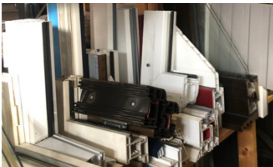
AFB. 3 Een van de bouwcomponenten die in de laatste decennia van de 20ste eeuw een sterke evolutie doormaakten, met name door strengere isolatienormen en dankzij innovatieve productietechnieken, zijn raamkaders, zoals deze stalen in de materiaalbibliotheek van UCLouvain aantonen (BAIU-Bruxelles) (© Marylise Parein, 2023).