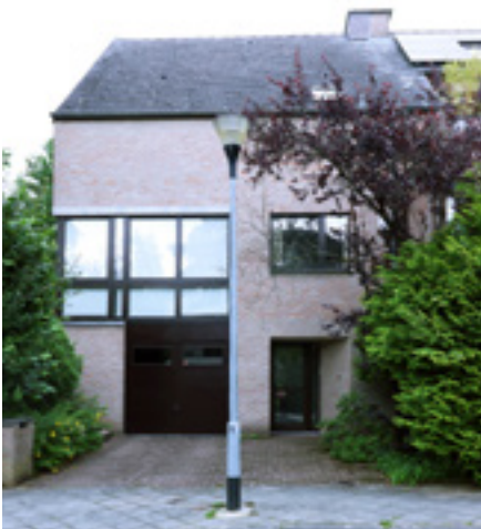
AFB. 6C Groenteboerstraat nrs. 61-63 in Sint-Agatha-Berchem.