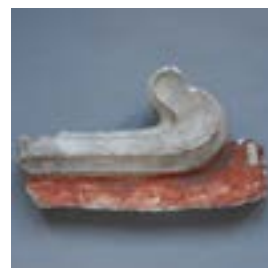
6.12 Model, inv. M.235.