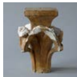
6.11 Model voor kapiteel, inv. M.106.