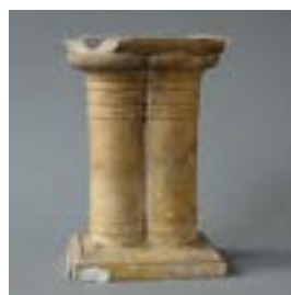
6.8 Model voor dubbele zuilen, inv. M.231.