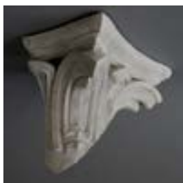
6.3 Model voor een kapiteel voor de Waucquez warenhuizen, inv. M.222.