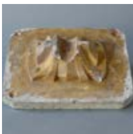
6.4 Model voor een zuilvoet voor het Huis Frison, inv. M.225.