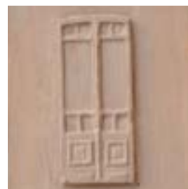
6.10 Model voor deur (miniatuur), inv. M.066.