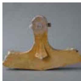
6.9 Model, inv. M.233.