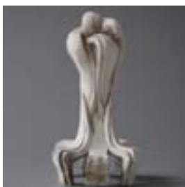
6.5 Model, inv. M.228.