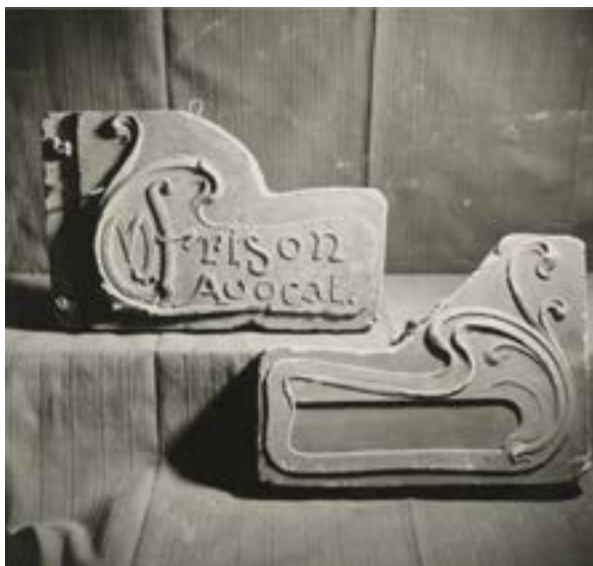
AFB. 5 Jean Delhaye, foto van twee gipsmodellen, genomen tussen 1960 en 1980.

Université Libre de Bruxelles (ULB). 5 Er werden ook bezoeken georganiseerd voor collega's, specialisten en studenten van andere instellingen.