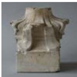
6.1 Model voor een zuilvoet voor het Volkshuis, inv. M.219.

Enkele gipsmodellen van het Hortamuseum die zijn opgenomen in de inventaris van het roerend erfgoed.