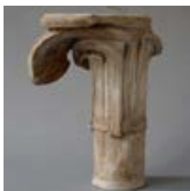
6.2 Model voor een kapiteel, inv. M.221.