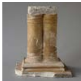
6.7 Model voor dubbele zuilen, inv. M.230.