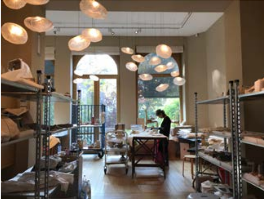
AFB. 3 Tijdens de inventarisatie van gipsmodellen, 2019