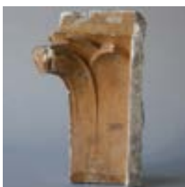
6.6 Model voor het kapiteel van een pilaster van Hôtel Max Hallet, inv. M.229.1.