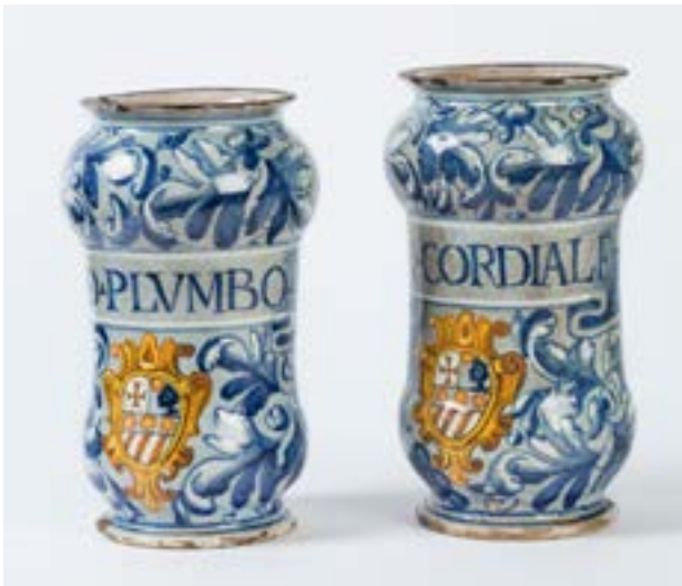
AFB. 6 Paar albarelli in majolica met polychroom decor, Venetië of Gubbio (Italië), tweede helft van de 16de eeuw. Brussel, gemeentehuis van Sint-Gillis, inv. 1382P.

7. DELEVOY, R., Les XX, Bruxelles: Catalogue des dix expositions annuelles , Centre international pour l'étude du XIX e siècle, Brussel, 1981, p. 86.