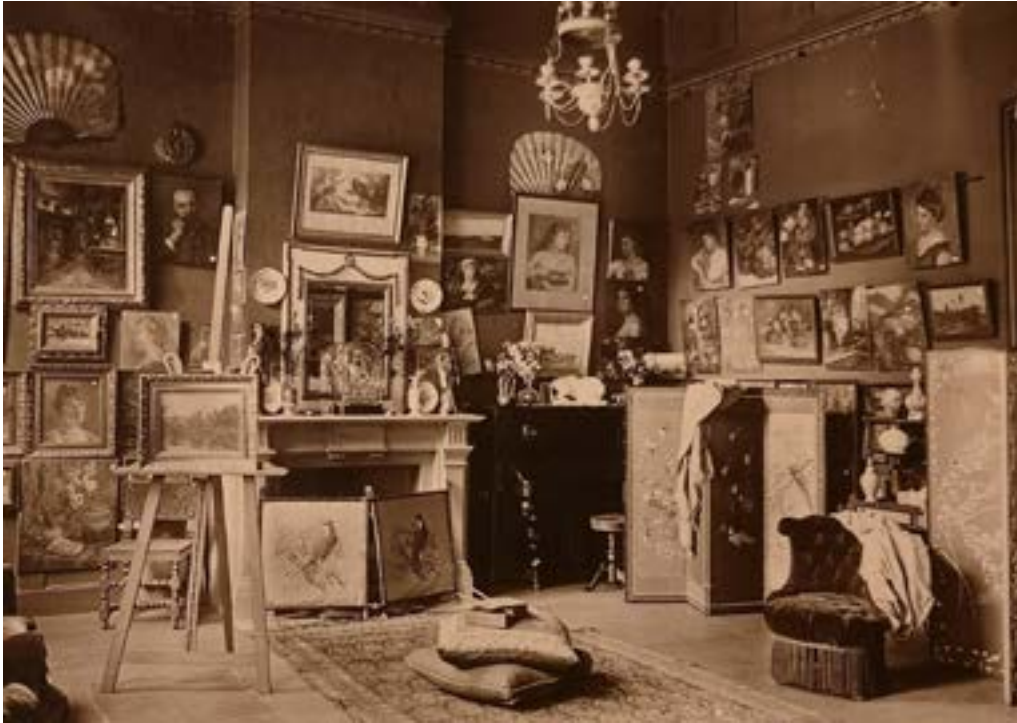
AFB. 8 Interieur van het atelier van Mathilde Demanet op de eerste verdieping van het Speekaertmuseum, circa 1915.