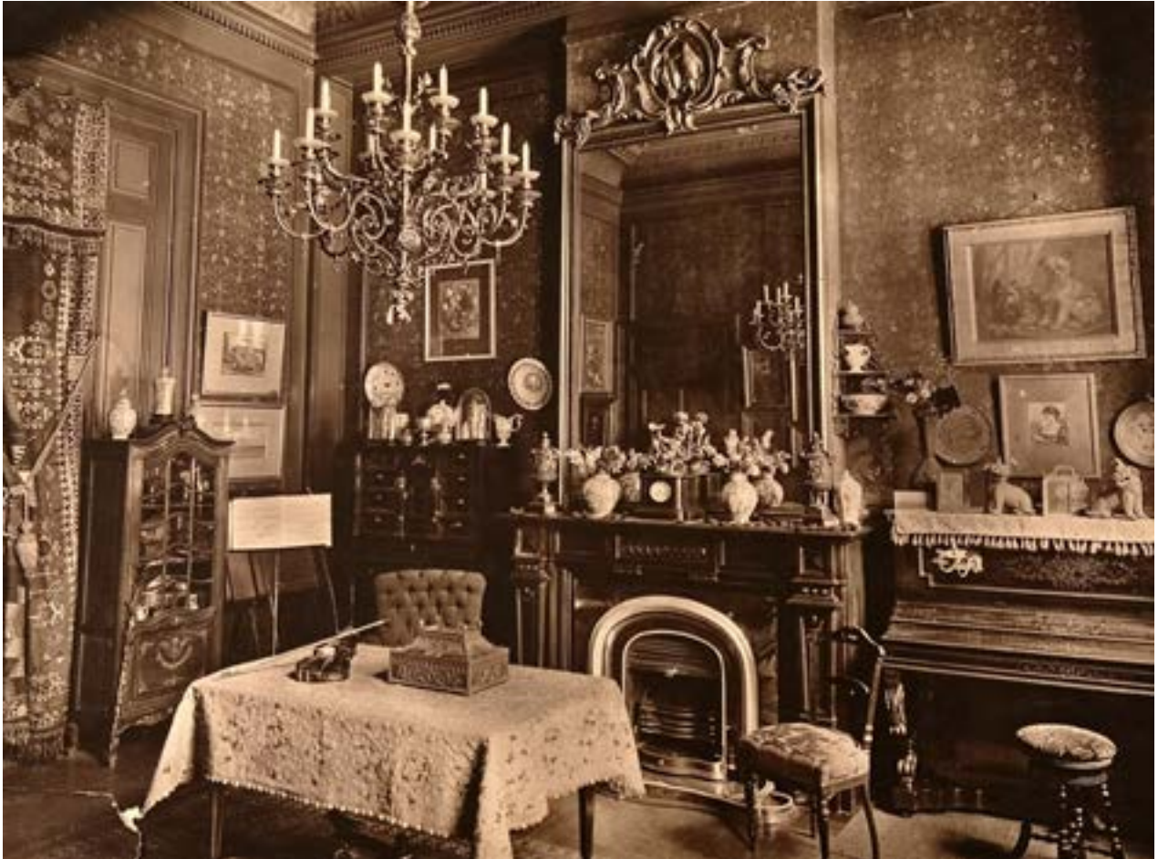
AFB. 5 Interieur van het salon van het Speekaertmuseum, circa 1915.