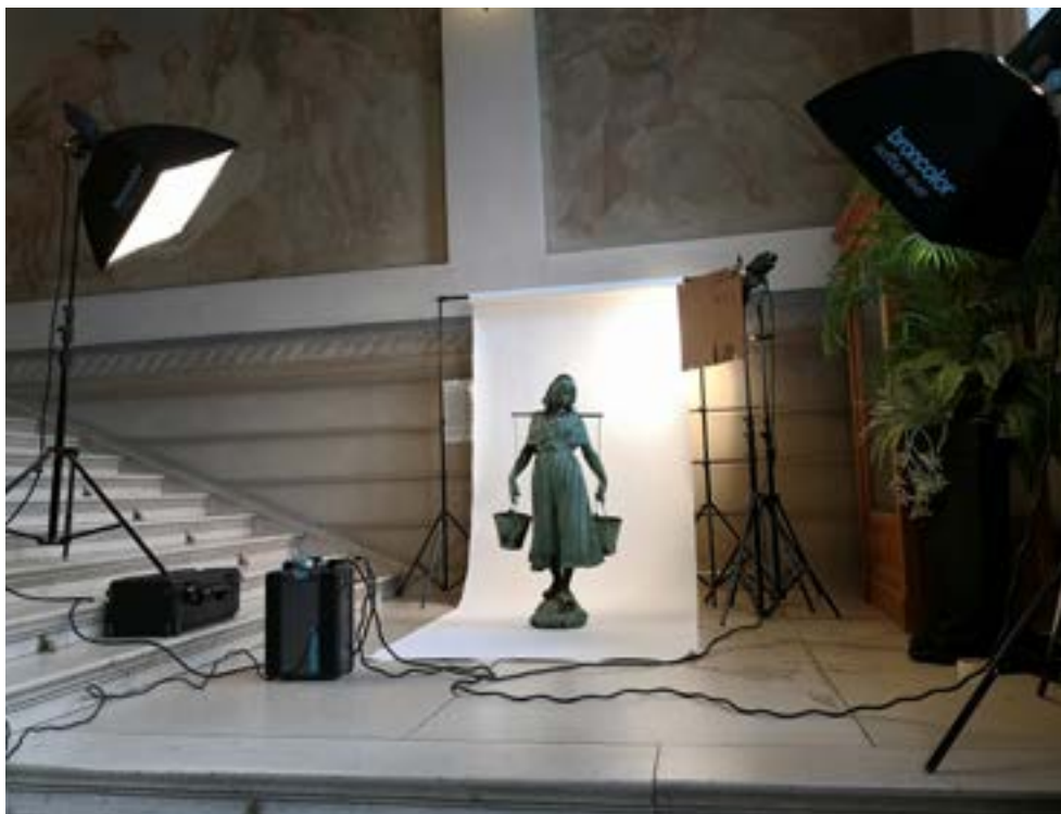
AFB. 2 Het KIK-inventarisatieteam aan het werk op de eretrap van het gemeentehuis van Sint-Gillis in 2020.

van de kantoren, kabinetten en gangen. Sommige werden opgeslagen op de zolder, waar ze bijna een halve eeuw sluimerden voordat ze in 2019 werden herontdekt bij het opmaken van de inventaris van de gemeentelijke collecties.