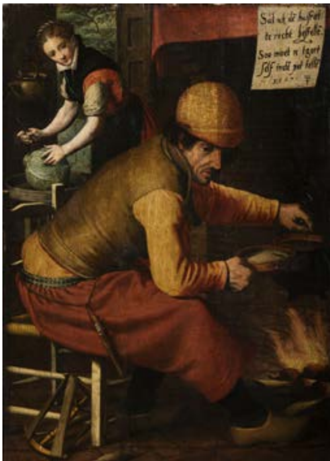
AFB. 7 Pieter Pietersz. Gortenteller, 1567, olieverf op hout, 97,5 x 68 cm. Brussel, gemeentehuis van Sint-Gillis, inv. 1175T.

van 1880. Hij nam als gast deel aan de derde tentoonstelling van Les XX in 1886, waarmee hij zich aansloot bij de avant-garde. 7 De schilderijen die hij koos om tentoon te stellen – Ochtend (September. Oevers van de Maas), Middag (Augustus. Abdij van Villers), Avond (April. Hallepoort) of nog Maagdelijke sneeuw ( Opkomende Zon. Lanen ) (AFB. 4) – geven blijk van een grote gevoeligheid voor lichteffecten. In 1898 organiseerde Speekaert een overzichtstentoonstelling van zijn werk in zijn galerijen ten voordele van de plaatselijke armen. Ter gelegenheid hiervan publiceerde hij een catalogus met 133 schilderijen en tekeningen 8 , de kern van zijn latere legaat.