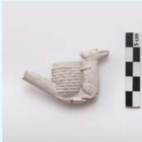
AFB. 6 Pijpenkop in aardewerk uit de 18de eeuw in de vorm van een mand met een konijn. Vindplaats : Schuitenkaai, Brussel