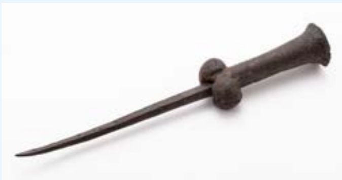
AFB. 3 'Klotendolk' (14de-16de eeuw). Opgegraven op de site van de voormalige Parking 58 in de Hallenstraat in 2019.