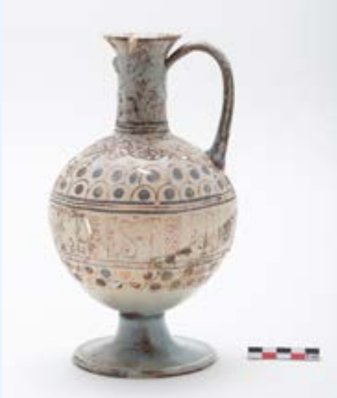
AFB. 1 De lattimo glazen vaas uit ca. 1600, gedecoreerd met goudverf en tekst in email, is waarschijnlijk van Venetiaanse oorsprong en werd in 2004 opgegraven in de Dinantstraat.