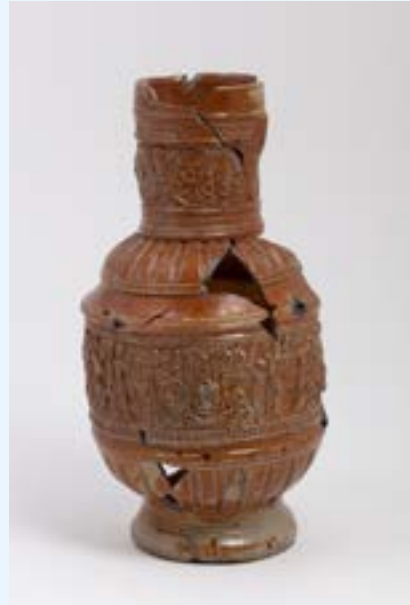
AFB. 2 Steengoed kan met reliëfdecoratie met voorstelling van het verhaal van Susanna en de ouderlingen, gedateerd 1584. Opgegraven in het Fontainaspark in 2016 (B. Felgenhauer © urban.brussels).