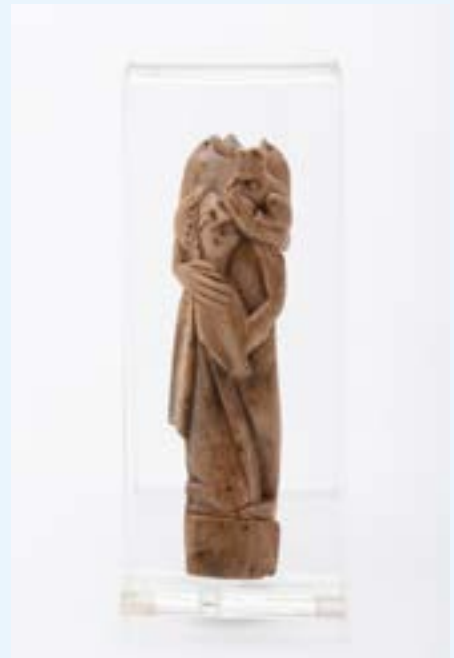
AFB. 4 Benen mesheft, versierd met een voorstelling die huwelijksrouw symboliseert (1400-1525) Vindplaats: Simone De Beauvoirpark (Fontainaspark), Brussel