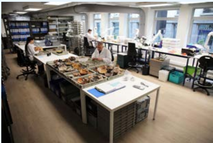
AFB. 1 Het archeologisch laboratorium van de Gewestelijke Overheidsdienst Stedenbouw en Erfgoed, urban. brussels

Deze stalen leren ons meer over de periode waarin en de manier waarop voorwerpen tot stand kwamen. Omdat onze interpretatie van het archeologische verleden ervan afhangt, moet elke selectie goed overwogen, beschreven en geregistreerd worden.