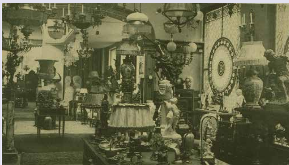
AFB. 1 Winkel van de Cie des Bronzes

Houtstont speelt de rol van initiator van die ontwikkeling in België en krijgt daarvoor in de vakpers ook waardering 3 . Houtstont werkt zijn hele carrière samen met de Compagnie des Bronzes , die als een kunstfabriek bestempeld wordt. De interactie tussen enerzijds artistieke productie op beperkte schaal en anderzijds een op de markt afgestemde grootschaliger productie, zet de toon in het bedrijf 4 . In de productie van decoratieve objecten in brons speelt het gipsmodel een cruciale rol en het is daar dat Houtstont zijn rol kan spelen. Hij maakt op basis van het hem aangereikte ontwerp – of naar eigen ontwerp – een gipsmodel, dat dan door de brongsieter wordt gegoten.