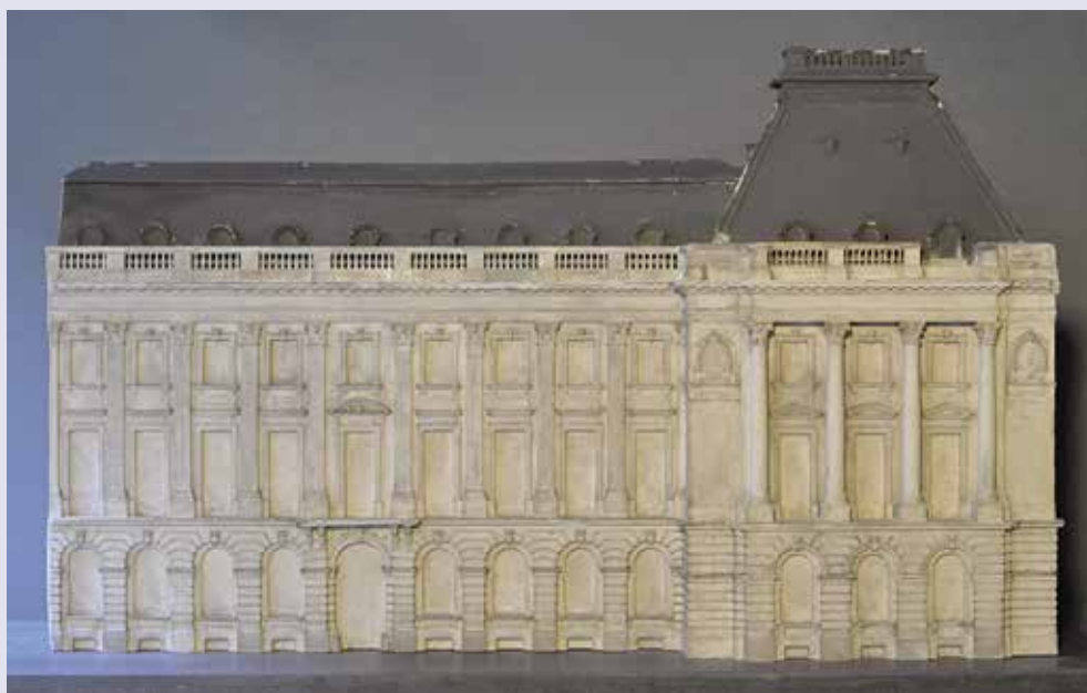
AFB. 1 Gipsen maquette van de gevel van het Koninklijk Paleis, gemaakt door Houtstont voor arch. Henri Maquet ca. 1904

Een maquette is ook een essentieel onderdeel van een ontwerpproces. Het was gedurende eeuwen de ultieme manier om een gebouw in zijn driedimensionaliteit voor te stellen. Wat schetsen, tekeningen en plannen niet vermogen, dat kan de maquette wel: de ruimtelijkheid van een gebouw oproepen. De maquette is bijgevolg een belangrijk instrument om de opdrachtgever te overtuigen van de kwaliteiten van de architectuur in wording. De maquette is in dat geval de allereerste visuele vertaling en de maker ervan staat dus kort bij de ontwerper. Maquettes kunnen in uiteenlopende materialen worden gemaakt: hout, karton of gips. Houtstont maakt alleen maquettes in gips. Ook de schaal van een maquette kan aanzienlijk variëren en het is niet uitzonderlijk dat er van éénzelfde gebouw(onderdeel) meerdere maquettes worden gemaakt op verschillende schalen. Het is soms moeilijk in te schatten waarom van bepaalde delen van een gebouw een maquette gemaakt wordt. Zo zijn er verschillende maquettes van Houtstont voor onderdelen van het kasteel in Gaasbeek bewaard 3 .