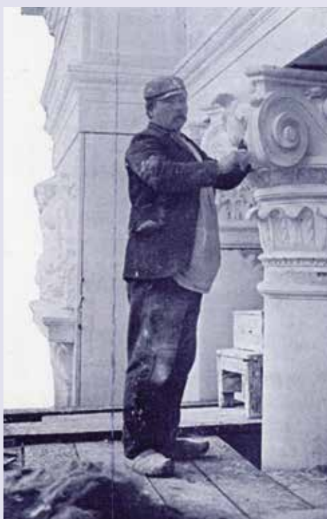
AFB. 1 Een stucwerker op de Wereldtentoonstelling te Brussel 1910 in Bruxelles-Exposition. Organe officiel de l'exposition de 1910, Rossel, Brussel, t.I, p.278.

Gaandeweg zal de drang naar opzichtigheid en decoratie op kritiek stuiten, omdat zulks de moderniteit in de weg zou staan. De discussie rond die paradox laait op bij de Brusselse Wereldtentoonstelling in 1910, waar de Beaux-Artsstijl meer dan ooit de toon zet 1 .