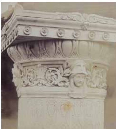
AFB. 3B Gipsmodel voor de ornamenten op de Congresskolom.

30. Archives Nationales Parijs, F/21/1754. Dat blijkt uit de betalingen voor zijn werken aan het Louvre die lopen van maart 1856 tot juni 1857 en die hervatten van september 1860 tot januari 1861.