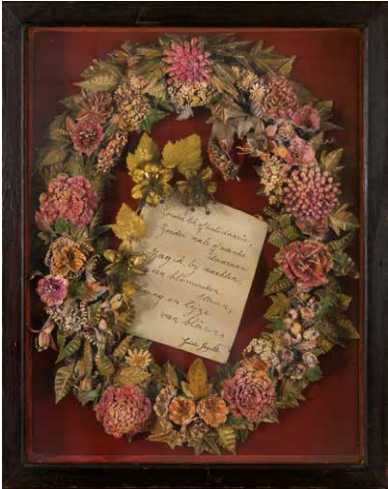
Kader met het 'handschrift' van Guido Gezelle.