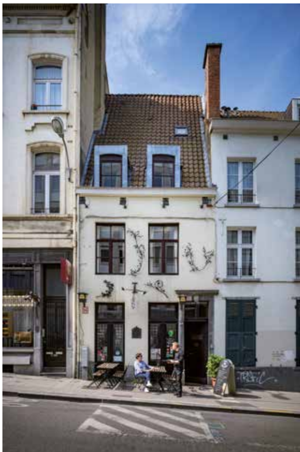
Gevel aan de Cellebroersstraat.

Als het kroegje zich niet in de Brusselse Cellebroersstraat zou bevinden maar pakweg op de hoek van de rue Saint-Médard en de rue Mouffetard in Parijs, dan was het Goudblommeke wijd en zijd bekend als een perfect voorbeeld van wat de Fransen een lieu de mémoire noemen. Het is de historicus en académicien Pierre Nora die deze uitdrukking in de Grand Robert heeft gekatapulteerd. Tussen 1984 en 1992 verschenen onder zijn leiding drie vuistdikke delen van het standaardwerk Les Lieux de Mémoire . 1