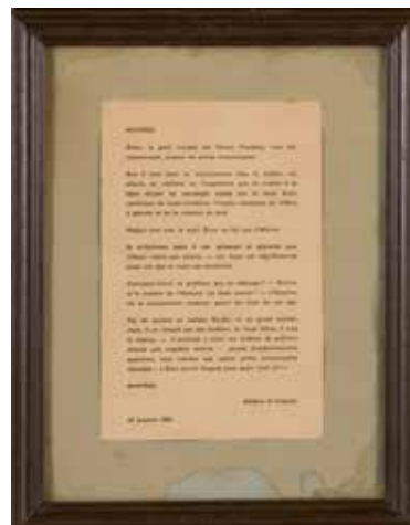
↑ Een ingekaderde pagina uit 'Livre d'Or de La fleur en papier doré' van Geert van Bruaene.