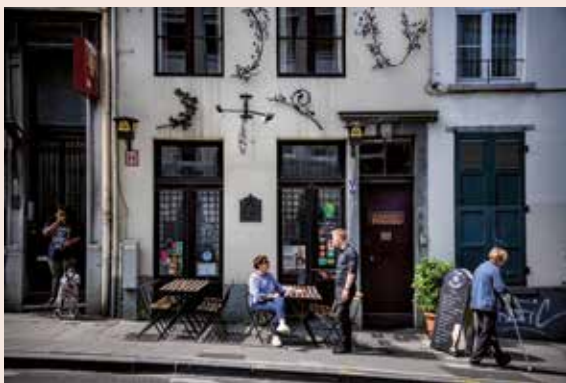
(© Lander Loecx, 2019 / vzw Geert van Bruaene).

Het beschermingsdossier bevatte een bundel van 11 sfeerfoto's die echter niet helemaal overeenkwamen met wat de vzw aantrof bij de overname op 1 oktober 2006. De 'inventaris' bestond bovendien enkel uit een summiere beschrijving. Om het café nieuw leven in te blazen moesten de nieuwe uitbaters twee schier