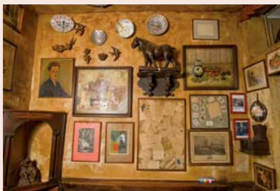
Na het wegnemen van de kaders bleef op de muren de blauwdruk achter van de kaders en objecten. De nicotine-patina werd voorzichtig gereinigd en achteraf opnieuw geëvoerd met een 'geheim' verfrecept op basis van Piedboeufbier. Foto's voor en na de restauratie.