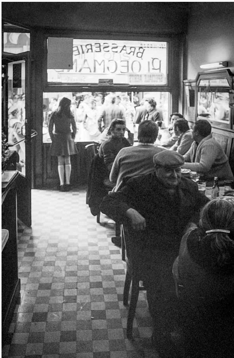
Café Ploegmans, Hoogstraat 148, in 1975

De tentoonstelling richt zich tot een familiaal publiek en duikt in de geschiedenis van deze zakenwijk tijdens de periode dat Brussel ingrijpende wijzigingen onderging en de allures kreeg van een bruisende grootstad.