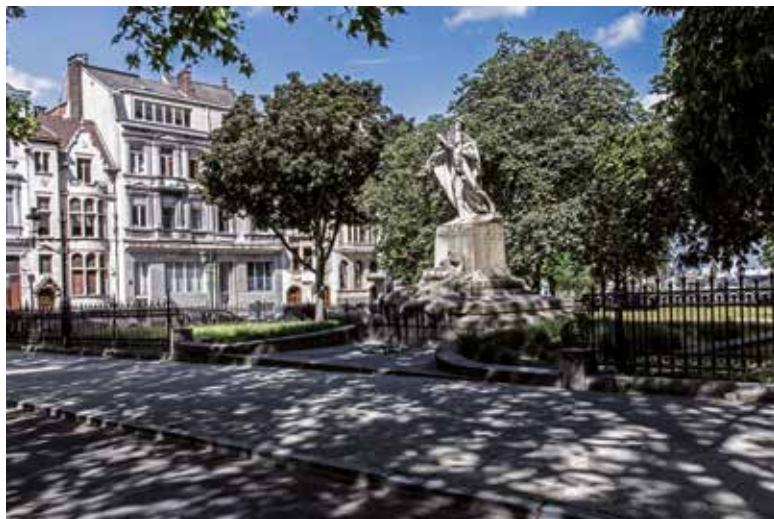
Jan Jacobsplein te Brussel

Het plantsoen werd in 1986 ingrijpend gewijzigd voor de inrichting van een speelplein, zonder dat er rekening werd gehouden met het oorspronkelijke ontwerp. Bij die gelegenheid werd een aantal hoogstamige bomen geplant die nu het zicht op het Justitiepaleis vanaf de ringlaan belemmeren. De beschermingsprocedure werd in gang gezet door de vzw Kunstwijk met een beschermingsaanvraag voor het hekwerk, dat in slechte staat verkeert. De beschermingsmaatregel werd uiteindelijk uitgebreid tot het volledige plantsoen zodat de originele bestemming, het oorspronkelijke uitzicht en de historische waarde in ere kunnen hersteld worden.