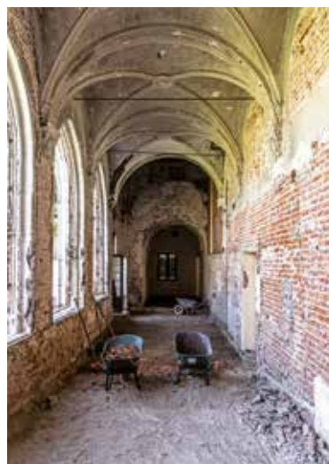
Priorwoning van het Rood Klooster tijdens de werf

voerd tijdens het priorschap van Jean Veron (1454-1455). Op grond van de lopende studies konden reeds een aantal hypotheses worden geformuleerd inzake de architecturale ontwikkeling van de kloosterkern van de 15de tot de 17de eeuw.