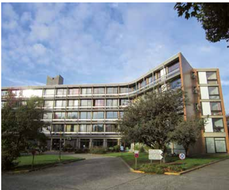
Residentie Bloemendal, Albertlaan 88 te Sint-Agatha-Berchem (Wim Kenis, 2014 © Urban.brussels)

Bloemendal vormt een organisch geheel waar elk element zijn plaats heeft op functioneel, constructief en esthetisch vlak. De vorm van het gebouw wordt bepaald door de oriëntatie van de kamers en verblijfsruimten met het oog op een optimale verlichting. Het grondplan is dynamisch door de aanwezigheid van de zwaluwstaar-