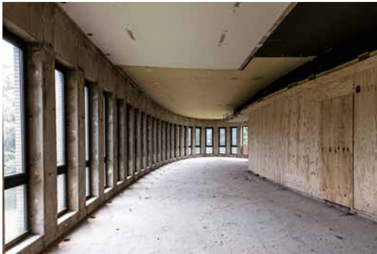
Rectoraat van de VUB tijdens de werf