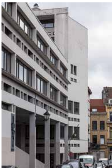
De school Peter Pan te Sint-Gilles

Prospective ". Deze dag, die in het CIVA plaatsvindt, wil de rijkdom en de diversiteit van het beton in het Brussels Gewest onder de aandacht brengen evenals de uiteenlopende behandelingen en ingrepen op zowel historisch als hedendaags beton. Een eerste deel onderzoekt de specifieke rol van België en Brussel in de geschiedenis van het beton, op basis van het Fonds Blaton dat bewaard wordt in de AAM (Stichting CIVA). Gedurende de dag zijn er ook bezoeken gepland aan dat fonds. Tijdens het tweede deel komen de verschillende benaderingen aan bod inzake het behoud van het betonerfgoed, rekening houdend met zijn materiële en historische dimensie. Het derde deel analyseert welke maatschappelijke uitdagingen en welke rol het beton vervult in de hedendaagse architectuurproductie. Ten slotte lichten architecten Jan en Pascale Richter (bureau Richter & Associés, Straatsburg), 's avonds, tijdens de afsluitende lezing, de filosofie toe achter de bouw van het gespecialiseerde hospitaalcentrum van Jury