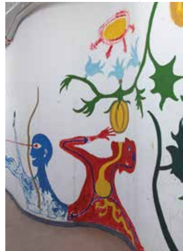
Muurschildering van de hand van R. Braem

ken van de ellipsvormige ruimten en de omschakeling naar een open space werkvloer. Op de gelijkvloerse en eerste verdieping zijn de afbraakwerken reeds afgerond. Zelfs in de ruwbouwfase onthullen de vrijgekomen ellipsvormige ruimten reeds hun uitzonderlijke kwaliteiten. Staan nog op het programma: de restauratie van de muurschilderingen (tijdens de werf zorgvuldig beschermd door een houten omkasting), van de oorspronkelijke tegelvloeren met het typische VUB-kleurenpalet ('oranje, blanje, bleu') en van de andere oorspronkelijke interieurelementen, het herstel van de originele polychromie van muren en plafonds, het plaatsen van een linoleumvloerbekleding zoals oorspronkelijk het geval was, maar ook de vernieuwing van de technische installaties (verwarming, elektriciteit, verlichting, ventilatie) en maatregelen ter verbetering van de akoestiek.