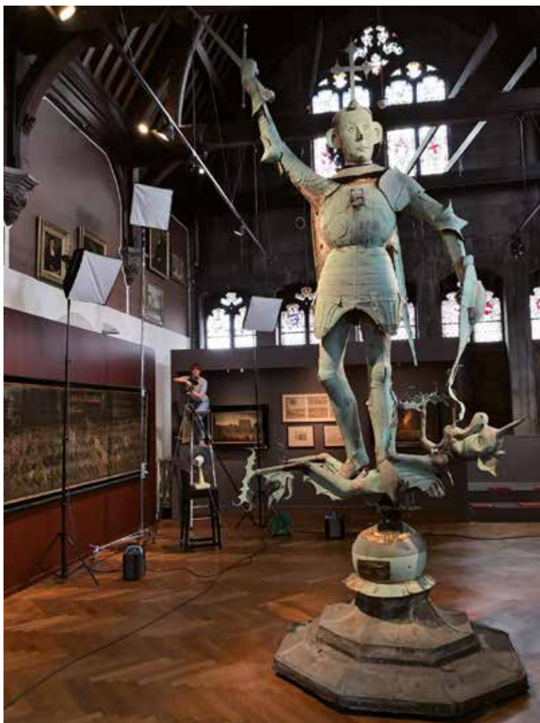
Het team van de inventaris van het onroerend erfgoed aan het werk in het Broodhuis

beschermen, bewaren en valoriseren, net zoals de Vlaamse, Franse en Duitstalige gemeenschap en de federale overheid die eveneens voor deze materies bevoegd zijn in België. Naast het opmaken van een inventaris zal de Brusselse regering dankzij diverse procedures binnenkort de meest opmerkelijke roerende cultuurgoederen kunnen beschermen en de goedgekeurde maatregelen ter behoud van deze goederen financieel ondersteunen. De rege-