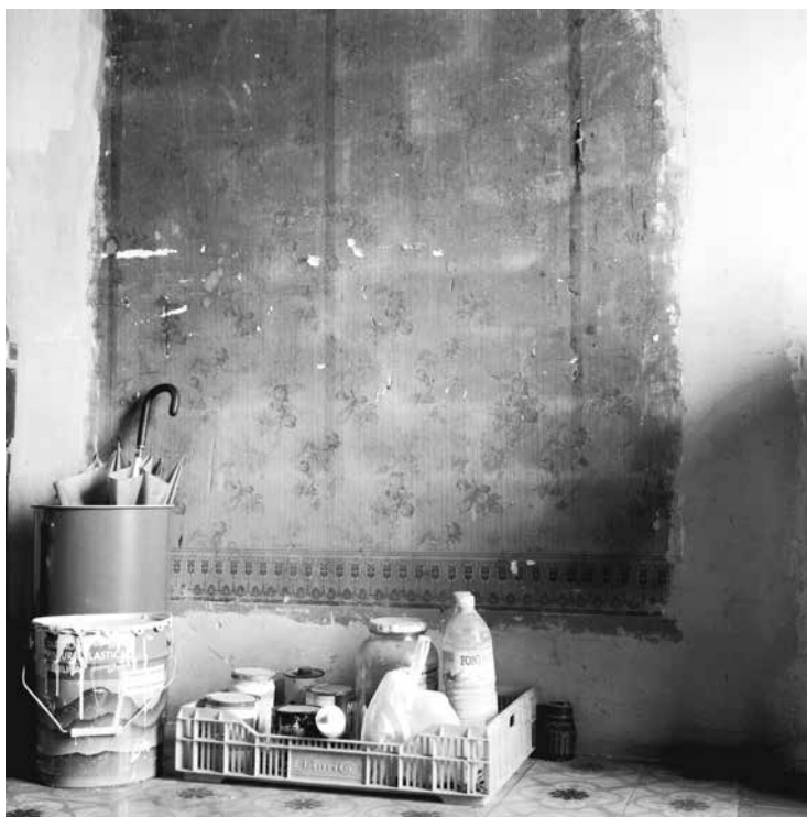
Art-nouveau-interieur, Terrasse (© Réseau Art Nouveau Network, foto: Serge Brison)