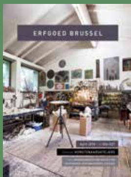
026-027 - April 2018 Kunstenarsateliers