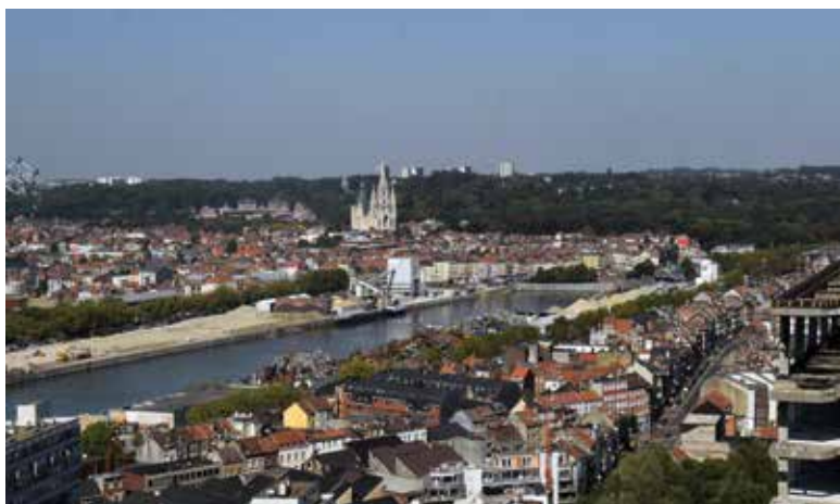
Zicht op het Vergotiedok te Laken vanuit het World Trade Center (© ARCHistory / APEB, 2016).

de jaren 1870-1880, uit gevend of vertrekkend vanuit de Maria-Christinastraat. De bebouwing is heterogeen en toont een diversiteit van neoclassicistische burgerwoningen en industriële bebouwing. Dit spanningsveld werd na de Eerste Wereldoorlog uitgebreid met een nieuwe residentiële wijk, gelegen ten zuiden van de Leopold I-straat volgend op de aanleg van de Emile Bockstaellaan.