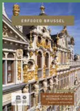
Extra nummer - 2018 De restauratie van een uitzonderlijk decor