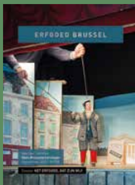
028 - September 2018 Het Erfgoed, dat zijn wij!