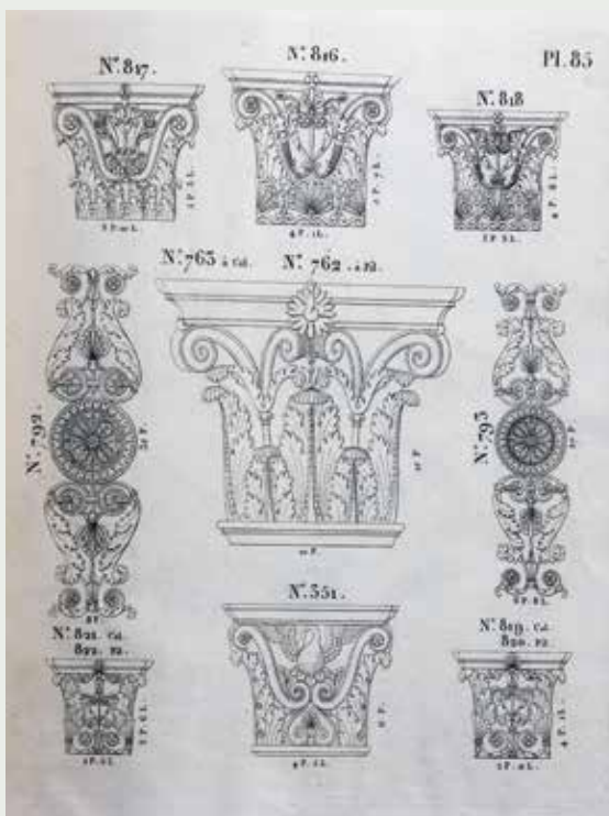
Plaat 85 uit de Recueil des dessins d'ornements d'architecture de la manufacture de J. Jph. Heiligenthal à Strasbourg, successeur de M. Beunat... , Strasbourg, vers 1830, met centraal een afbeelding van een model (nr. 762) van een pilasterkapiteel uit carton pierre.