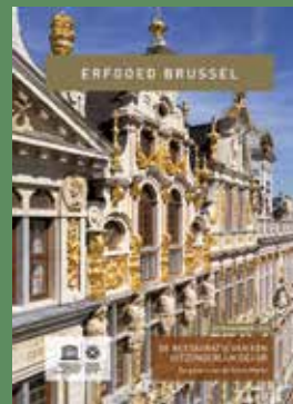
Extra nummer - 2018 De restauratie van een uitzonderlijk decor