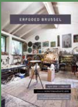
026-027 - April 2018 Kunstenarsateliers