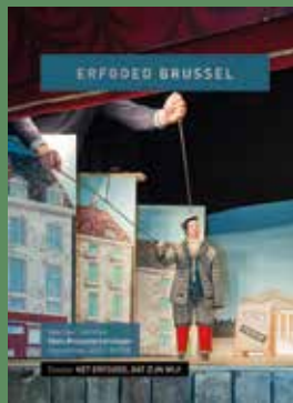
028 - September 2018 Het Erfgoed, dat zijn wij!