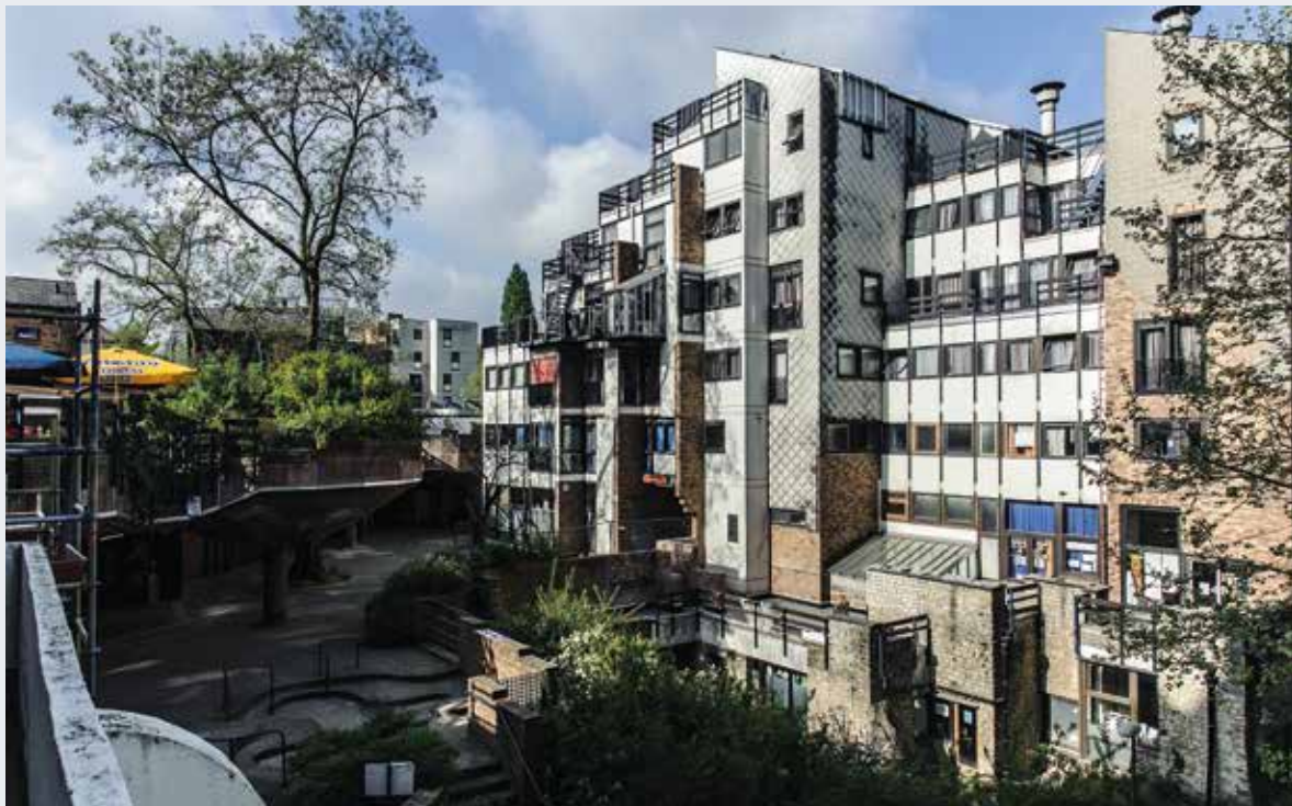
La MéMé, Atelier Simone en Lucien Kroll (1969-1976).

ARCHITECTE, SECRETARIS VAN DE KONINKLIJKE COMMISSIE VOOR MONUMENTEN EN LANDSCHAPPEN, DIRECTIE MONUMENTEN EN LANDSCHAPPEN