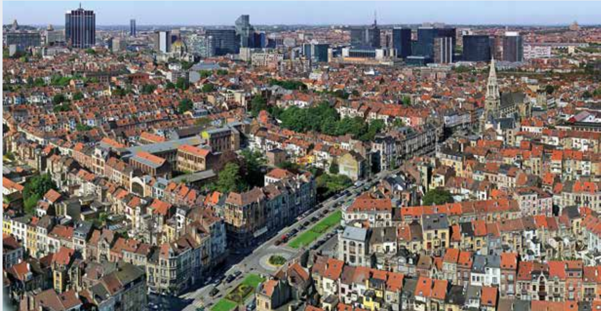
De Louis Bertrandlaan te Schaarbeek (© J. de Selliers, 2012).

De KCML stelde in april 2017 de bescherming voor van de Louis Bertrandlaan te Schaarbeek. Aangelegd tussen 1904 en 1913 vormt deze laan een van de mooiste stedenbouwkundige realisaties uit die periode. Haar breedte, kromming, uitwaaiing en wijds perspectief op het Josaphatpark,... Daarnaast is ze ook het uithangbord van de toenmalige architecturale stijlen, gaande van eclecticisme tot art nouveau. Haar historisch, landschappelijk en stedenbouwkundig belang verlenen de laan het statuut van eersterangs stedenbouwkundig erfgoed op schaal van het gewest.