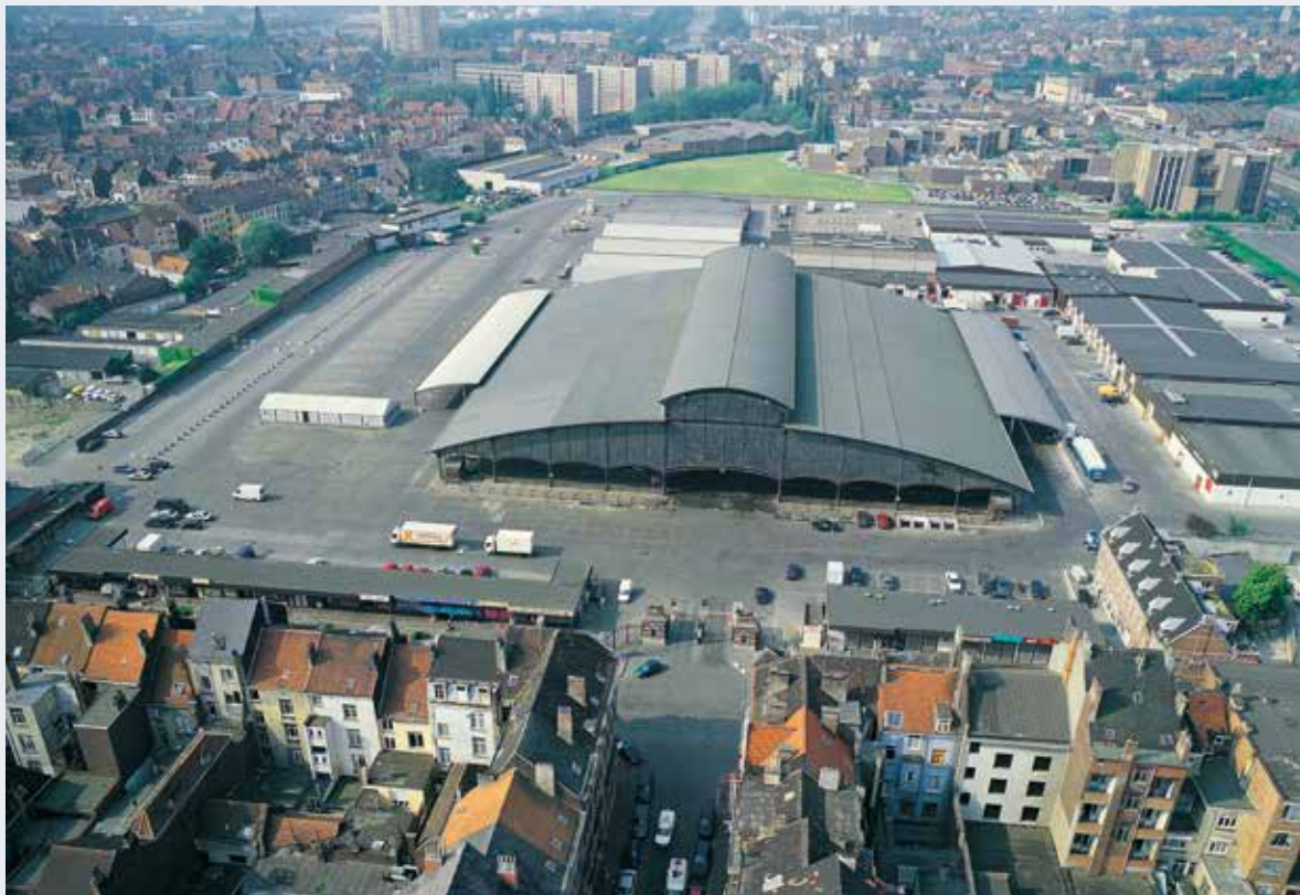
De overdekte markthal van de slachthuizen van Kuregem, Anderlecht.

In mei 2017 gaf de KCML een gunstig advies om het dak van de grote, als monument beschermde, overdekte hal te voorzien van een zonnepanelen. Dit soepele, dunne membraan volgt nauwkeurig de vorm van het dak en vergt geen opheffing. De donkere kleur en een plaatsingswijze die rekening houdt met de architecturale kenmerken van het dak en met het ritme van de oorspronkelijke zinkstroken waarborgt een harmonieuze integratie in het landschap. Een uitstekende kans dus om binnen dit project zowel erfgoedkundige als energetische uitdagingen met elkaar te verzoenen. De grote, homogene oppervlakken, de typologie van de daken van de slachthuizen en de stedenbouwkundige context lenen zich uitstekend tot deze oefening.