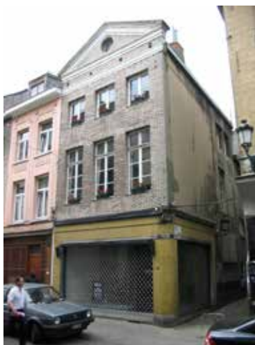
Afb.1a en 1b

Ter gelegenheid van het twintigjarige bestaan van het Gewest beschreef ik eerder in een gedreven en enthousiaste tekst 1 de vooruitgang die sinds de oprichting van het Gewest werd geboekt wanneer het stedelijk beleid rekening begon te houden met het erfgoed: "Ja, het gaat ontegensprekelijk veel beter met Brussel dan in het midden van de jaren '80. Niet-Brusselaars die het zich nog herinneren, zijn de eersten om dat te zeggen. Nee, Brussel is geen architecturale catastrofe! De nieuwe Brusselaars die voor Brussel hebben gekozen, zijn daarvan een duidelijk teken. Alleen moeten nog veel Brusselaars daarvan worden overtuigd. Misschien zelfs in het bijzonder diegenen die van de verdediging van het Brusselse erfgoed hun professionele of vrijwillige hoofdbezigheid hebben gemaakt. Om dat in te zien, is er niets beter dan de vergelijking van foto's vóór en na. En ja, Brussel is er inderdaad mooier op geworden. De esthetica en het stadsbeeld zijn er de voorbije 20 jaar absoluut op vooruitgegaan. Een succes van de regionalisering." 2