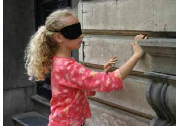
Afb.1a en 1b

Leren via het erfgoed. Ontdekking van het erfgoed in Elsene: vormen en materialen, doorheen de blik van de andere en met eigen handen. De verkenning van de wijk wordt een gemeenschappelijk avontuur dat banden schept (2004).