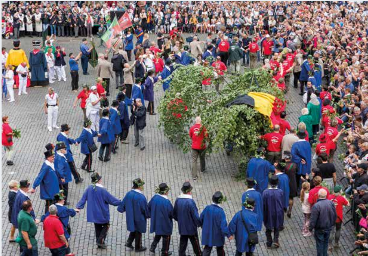
Meyboomstoet – 9 augustus 2017. Al sinds de Franse Revolutie reconstrueert deze stoet elk jaar, in de maand augustus, het privilege dat eind 13de eeuw aan de Brusselaars zou zijn verleend om een meiboom (ereboom) te planten ter ere van de patroonheilige van het Kruisboogschuttersgilde van Sint-Laurentius.

beschermd die speciaal door Joseph Hoffmann en de ateliers van de Wiener Werkstätte ontworpen werden voor dit 'paleisinterieur', maar ook aan de gemeentehuizen waar zich vaak schilderijen bevinden uitgevoerd door plaatselijke kunstenaars 12 , en uiteraard ook aan de kerken met hun meubilair en liturgische objecten die meestal verband houden met de parochie.