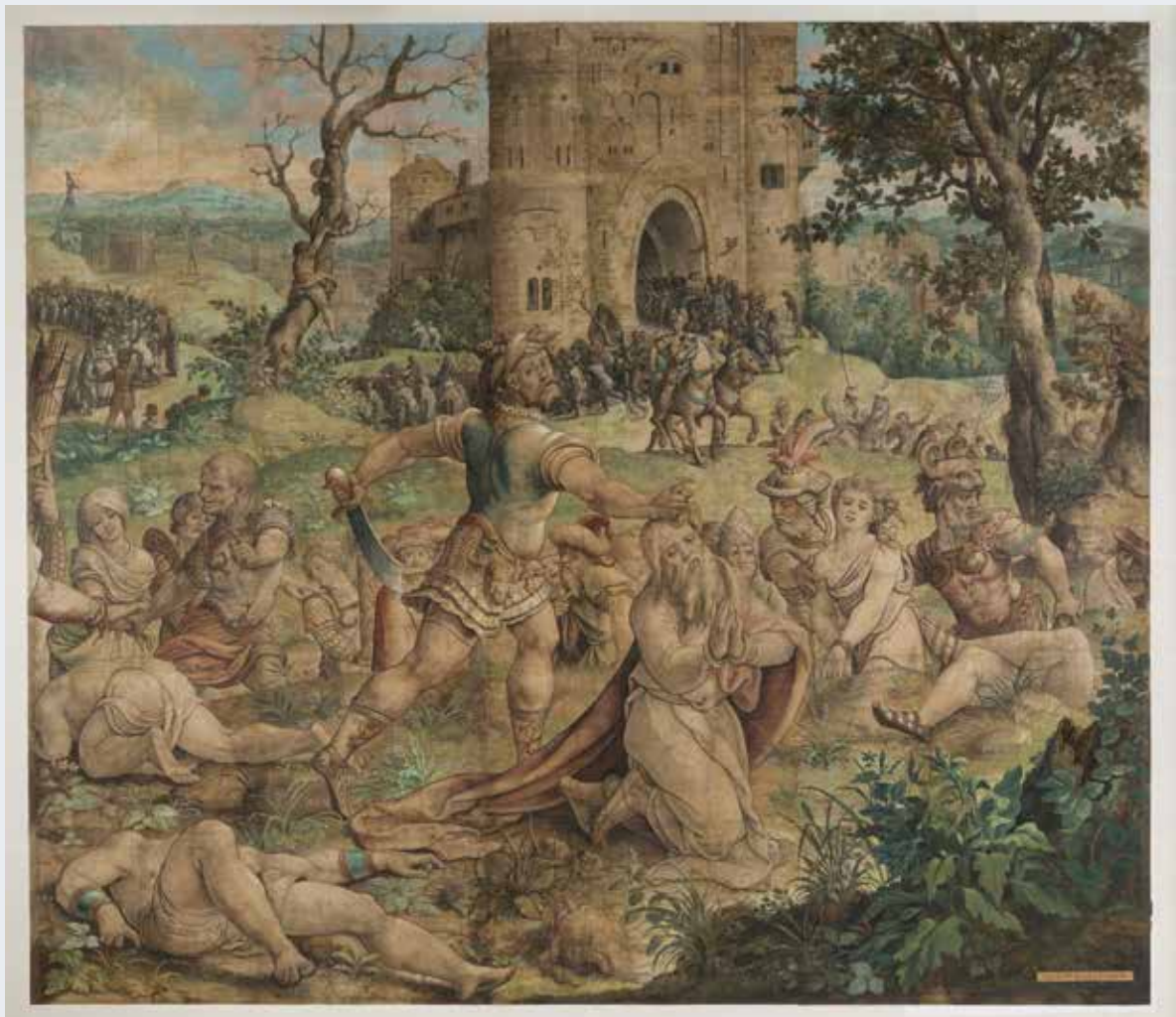
Pieter Coecke van Aelst, karton van het wandtapijt De onthoofding van de heilige Paulus , ca. 1530, bewaard in het Museum van de Stad Brussel. Een van de zeldzaamste 16de-eeuwse wandtapijtkartons ter wereld (© KIK-IRPA, Brussel_BUP/BSE, cliché L1898/3).

JURISTE, DIRECTIE MONUMENTEN EN LANDSCHAPPEN