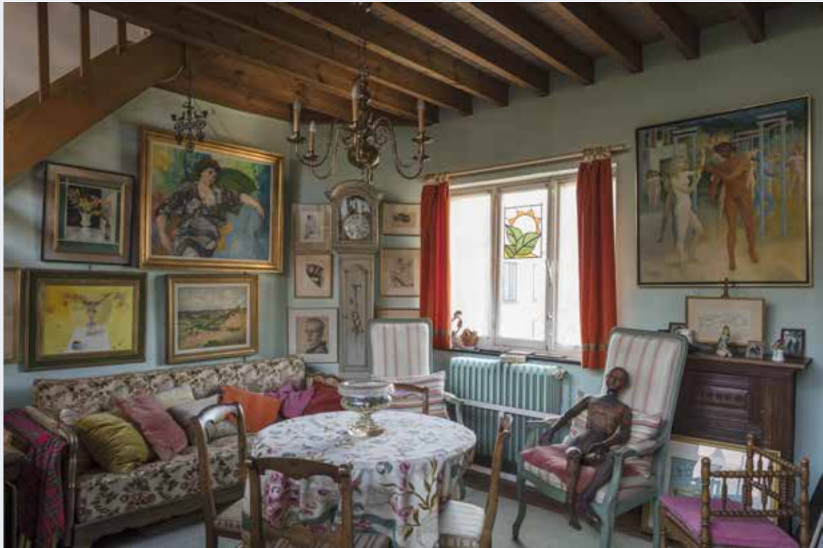
Interieur van een van de salons van de atelierwoning Fabry te Sint-Pieters-Woluwe.

erfgoed wordt genoemd: de tradities en uitdrukkingsvormen die we van onze voorouders overerven en aan onze nakomelingen doorgeven, zoals mondelinge tradities, podiumkunsten, sociale gebruiken, rituelen en feestelijke gebeurtenissen, of ook de kennis en knowhow van de traditionele ambachten.