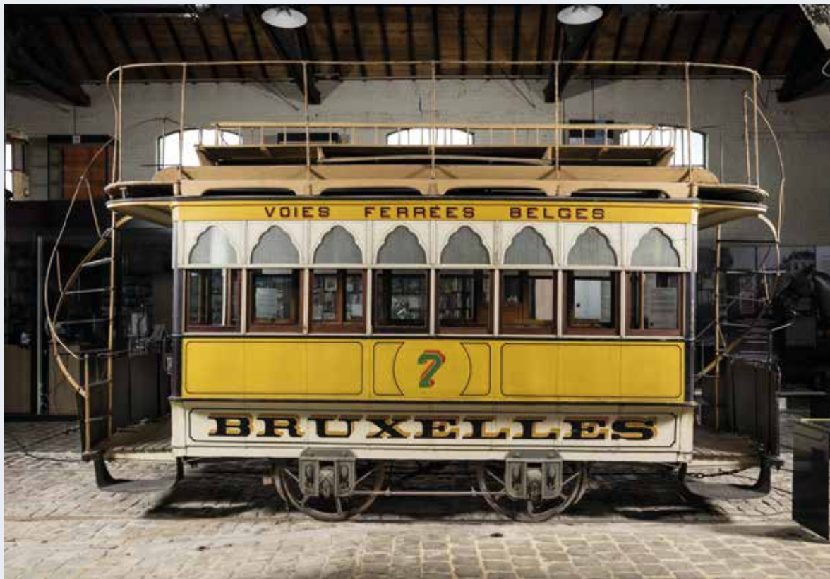
Paardentram 7. Rijtuig met imperiaal uit 1869, in dienst gesteld op de allereerste Brusselse tramlijn, die liep tussen de Schaarbeekse Poort en het Ter Kamerenbos. Het is waarschijnlijk de oudste tram ter wereld die in zijn oorspronkelijke staat is bewaard. Hij wordt bewaard in het Trammuseum.

rend erfgoed in al zijn verscheidenheid, maar ook tradities, gebruiken en knowhow.