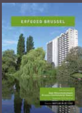
023-024 - September 2017 Natuur in de stad