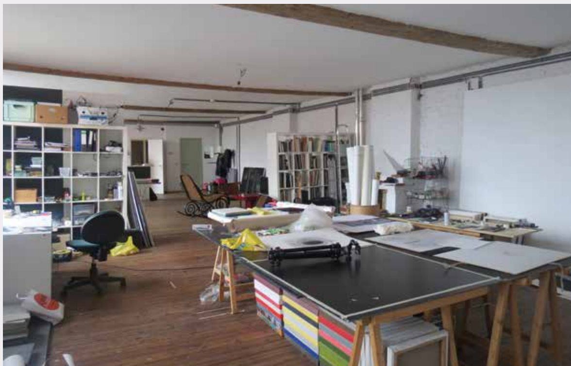
Atelier met woonruimte.

KUNSTHISTORICA, DIRECTIE MONUMENTEN EN LANDSCHAPPEN