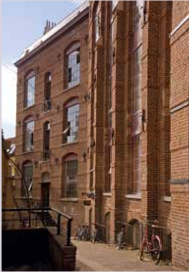
De baksteengevels en metalen ramen geven de site haar industrieel karakter.