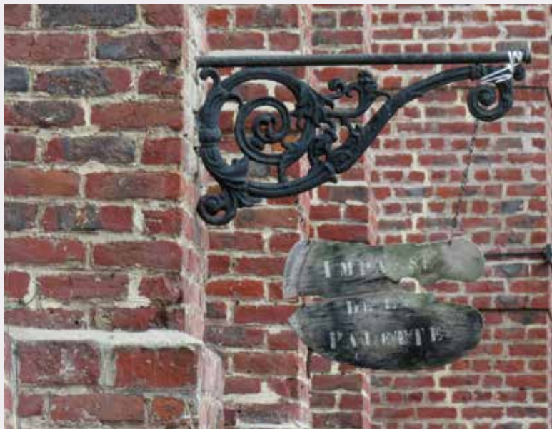
Impasse de la Palette, de officiële benaming van de gang die vanaf de straatkant toegang geeft tot de kunstenaarssite.

Mommen maakte. Het was een bijzonder goed zakenplan met een heel berekend risico.