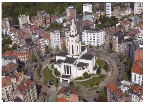
Hoogte Honderdwijk te Vorst.

De Hoogte Honderdwijk situeert zich in het noordoosten van de gemeente. Het eerste stedenbouwkundig project in de wijk kadert in de uitbreiding van de buitenwijken van Sint-Gillis en wordt opgesteld door stedenbouwkundige Victor Besme in 1876. Er wordt o.a. een nieuw park voorzien, het Parc du Midi (huidige Park van Vorst), waarlangs kronkelende lanen worden aangelegd die voorbehouden