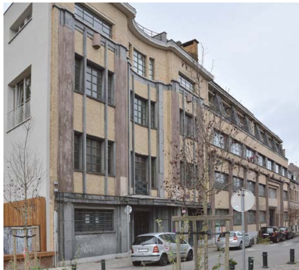
Voormalige vestiging van Le Magnéto belge, Marconistraat 121-123-125-127, Vorst.