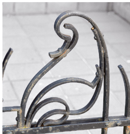
Afb. 15 Claysstraat 47, Schaarbeek. Detail van het tuinhek met een gestileerde Frygische muts (2016 © APEB).