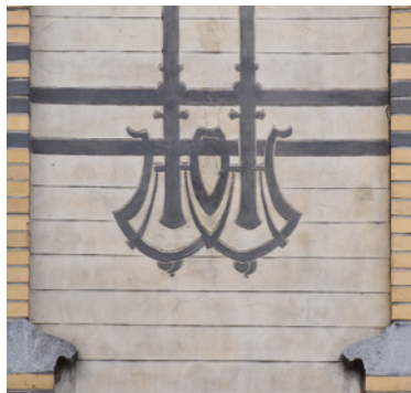
Afb. 10 Peter Benoitstraat 2-4, Etterbeek. Gecementeerd decor op de verdiepingen aan de kant van de Waversesteenweg, met een voorstelling van gestileerde lotusbloemen (2016 © APEB).