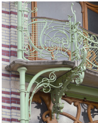
Afb. 16 De woning de Saint Cyr, Ambiorixsquare 11, Brussel Uitbreiding-Oost. Balkon op de tweede verdieping, met een console die opkrult tot aan de borstwering (2016 © APEB).