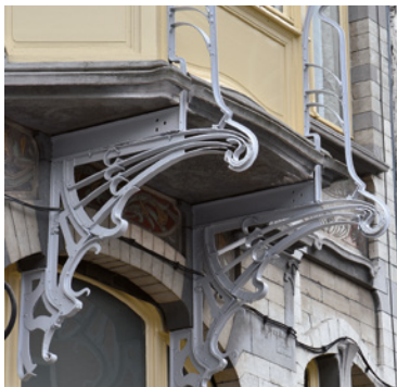
Afb. 11 Opperstraat 52, Elsene. Consoles van de erker met gestileerde korenschoof (2016 © APEB).