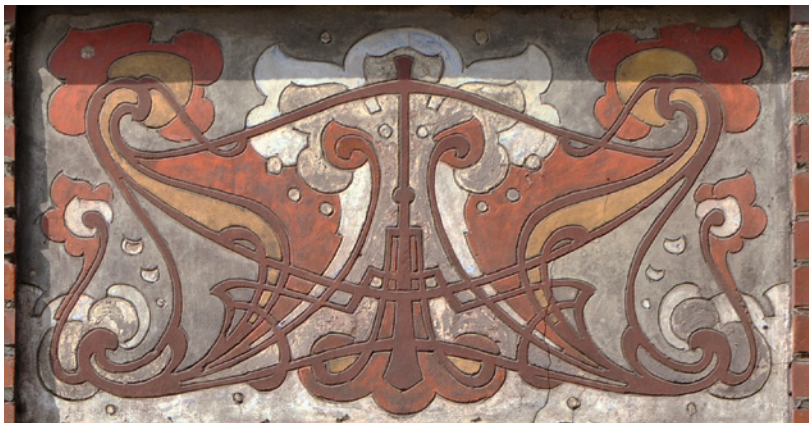
Afb. 17 Brabançonnellaan 82, Schaarbeek. Sgraffito op de eerste verdieping aan de kant van de laan (2016).