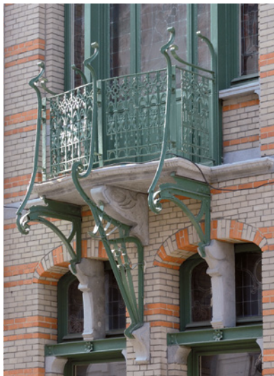
Afb. 8 Saint-Quentinstraat 30, Brussel Uitbreiding-Oost. Balkon met een afwisseling van ijzer en steen (2016).