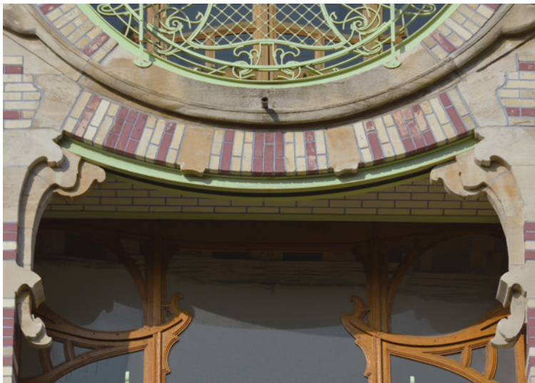
Afb. 9 Woning de Saint Cyr, Ambiorixsquare 11, Brussel Uitbreiding-Oost. Omgekeerde boog onder de oculus (2016).

Wellicht was het niet zozeer –zoals men vaak schrijft– om financiële redenen dat hij voor baksteen koos, dan wel voor het rijk geschakeerde palet dat dit traditionele Brusselse materiaal bood: rode, oranje, gele, bruine, crèmekleurige bakstenen, soms gevernist in crèmekleurige, groene of blauwe tinten. Zoals andere architecten decoreerde Strauven zijn gevels graag met banden gekleurde baksteen, maar hij onderscheidde zich wel door het ritme dat hij aan deze afwisselingen oplegde: in de Troonsafstandsstraat nr 4 (afb. 7), bijvoorbeeld, wordt de benedenverdieping overheerst door crèmekleurige lijnen, maar hoe hoger je kijkt, hoe intenser de rode lijnen worden, tot ze de bovenhand halen.