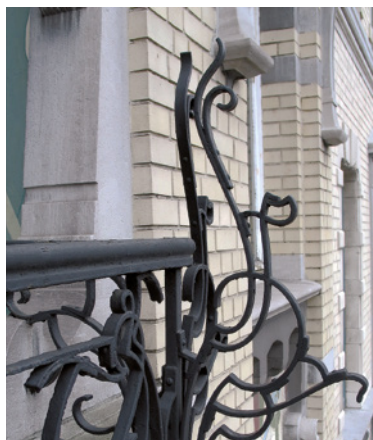
Afb. 13 Louis Bertrandlaan 43, Schaarbeek. Zweepslagmotief op het balkon van de tweede verdieping (2016 © APEB).