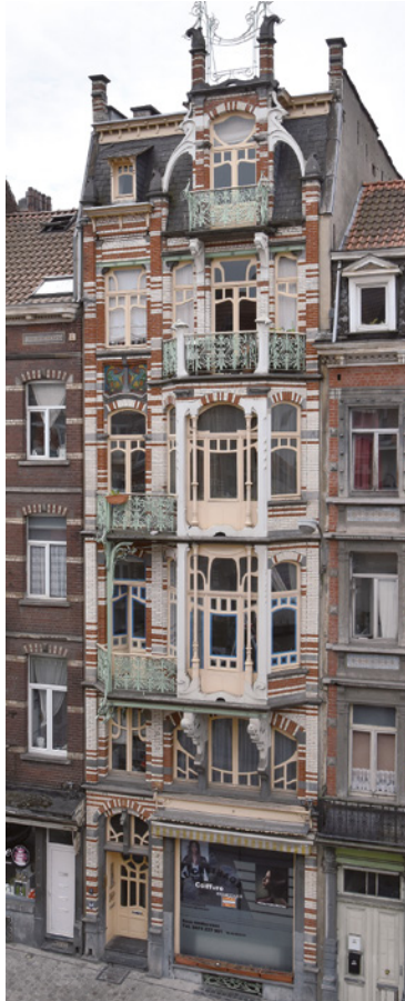
Afb. 19 Paul Dejaerlaan 9, Sint-Gillis (2016 © APEB).

Nog tijdens zijn leven lijkt Gustave Strauven al een invloed op sommige van zijn collega's te hebben uitgeoefend. Dat blijkt onder meer uit een gevel van architect Jacques Deweerdt, die in 1904 die van de woning de Saint Cyr parafraseerde (Cogels Osylei nr 80 in Berchem-Antwerpen), alsook uit de persoonlijke woning van Arthur Nelissen, die een jaar later een ocululus ontwierp op de bel-etage van Kemmelberglaan nr 5 in Vorst.