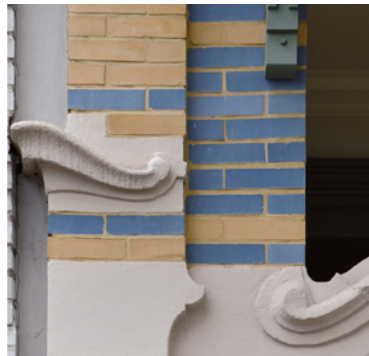
Afb. 12 Lutherstraat 28. Hoekdecoratie met gestileerde golf (2016 © APEB).