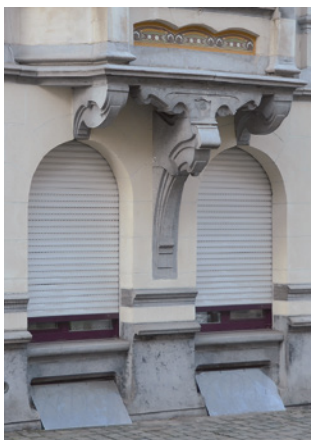
Afb. 14 Washingtonstraat 127, Elsene. T-vormige console die de Chinees-Japanse architectuur evoceert (2016 © APEB).