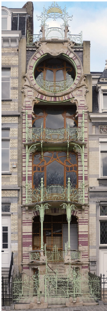
Afb. 2 Woning de Saint Cyr, Ambiorixsquare 11, Brussel Uitbreiding-Oost (2016 © APEB).

aan een wedstrijd voor een gemeenteschool in Etterbeek. Al deze plannen kwamen echter niet verder dan de tekenafel.