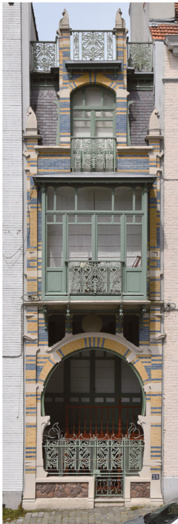
Afb. 3 Lutherstraat 28, Brussel Uitbreiding-Oost (2016).

In de loop van 1898 keerde Strauven terug naar Brussel en tekende hij de plannen voor zijn eerste twee realisaties: de dubbelhuizen op nr 148 en 150 Jozef II-straat. Tussen 1899 en 1903 ontwierp hij een twintigtal projecten in het Brussels gewest, waaronder de woning de Saint Cyr in 1900 (Ambiorixsquare 11) en