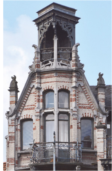
Afb. 20 Huis Van Dijck, Clovislaan 85-87, Brussel Uitbreiding-Oost. Geveltop met voorsteven- vormige loggia-belvédère (2016 © APEB).

Het eerherstel van de meester zelf werd al snel gevolgd door dat van de architecten van de tweede generatie. In 1971 werd aan de alarmbel getrok-