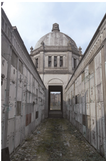
De centrale gang. Situatie in april 2016 na de restauratie.