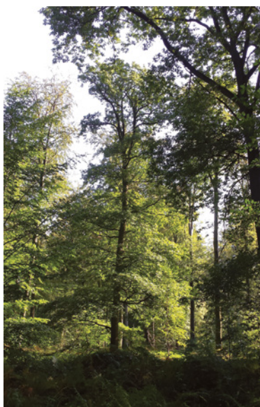
(L. Leroy © GOB).