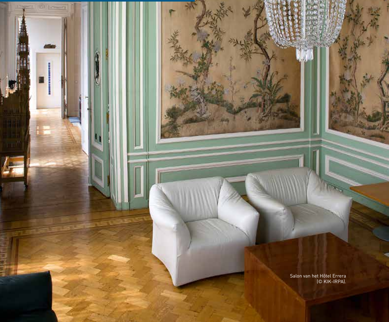
Salon van het Hôtel Errera.