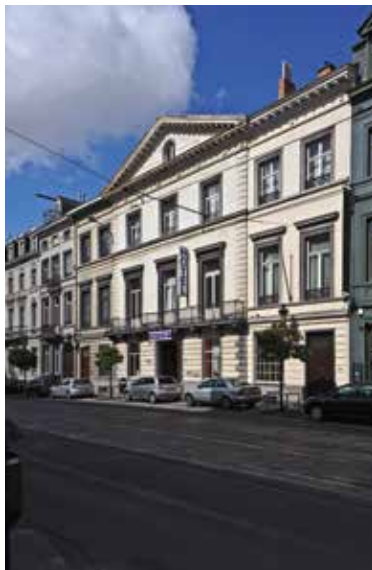
Afb. 3 Koningsstraat nrs. 310-314, Sint-Joosten-Node (A. de Ville de Goyet, 2016 © GOB).

imposante (smallere) gebouwen zien we soms een fronton van één travee (o.a. Koningsstraat nrs. 286 en 290). Voor het merendeel van de neoclassicistische gevels, die vaak zeer sober zijn, beperken de antieke verwijzingen zich tot de decoratieve elementen van het hoofdgestel (in het bijzonder de getande kroonlijst) en de algemene principes van de antieke architectuur (regelmaat, symmetrie, verhoudingen) (afb. 4).