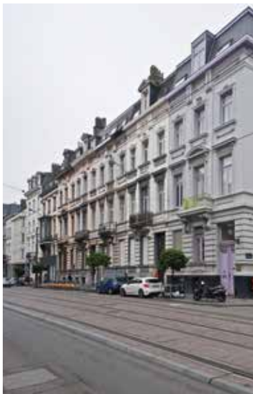
Afb. 4 Koningsstraat nrs. 253-261, Schaarbeek: neoclassicistisch geheel van vijf burgerwoningen gebouwd tussen 1867 en 1876 (A. de Ville de Goyet, 2016 © GOB).

De oudheid is niet alleen aanwezig in de gevels of interieurs van de woningen, maar ook in de publieke ruimte, via de beeldhouwkunst. Dat is zeer nadrukkelijk het geval in het