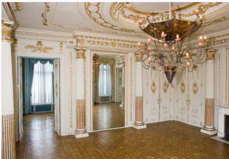
De gele salon van het Hôtel de Ligne (A. de Ville de Goyet, 2016 © GOB).