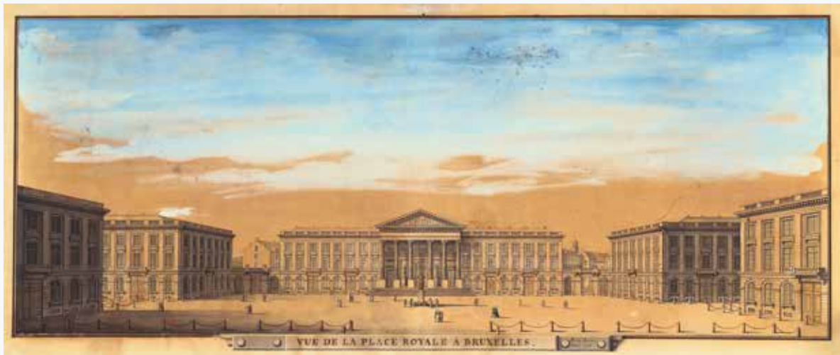
Zicht van het Koningsplein, Brussel. Tekening van François Lorent, eind 18de eeuw.

hoeken van het plein afsloten, riepen op kleinere schaal de herinnering op aan de Romeinse triomfbogen. De achterkant van het portiek dat uitgeeft op de vroegere Hofberg (huidige Museumstraat) bevat het grootste aantal antieke motieven: de centrale doorgang wordt geflankeerd door twee gecanneleerde Dorische zuilen die een klassiek hoofdstel dragen met kraagstenen, triglifien, druppels ( guttae ) en metopen met rozetten in het fries.