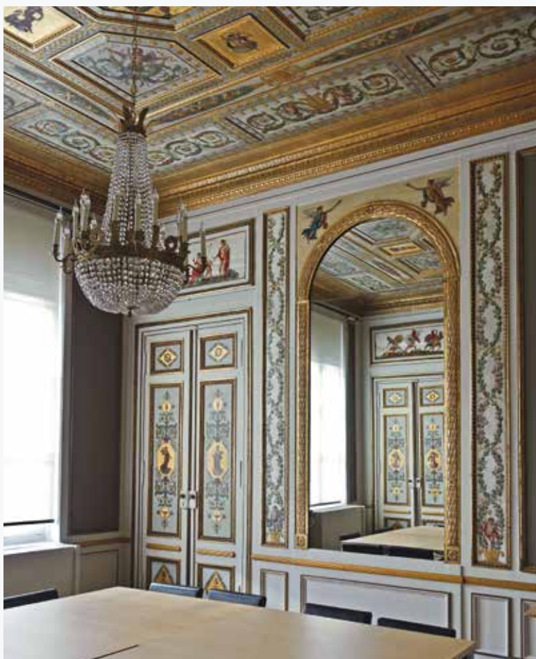
De Spiegelzaal van het Hôtel Errera.

De interieurdecoraties van het Hôtel Errera en het Hôtel de Ligne behoren tot de boeiendste voorbeelden van neoclassicistische woninginrichting. In het Hôtel de Ligne treffen we motieven aan ontleend aan de Pompeïsche grotesken en muurschilderingen, meer bepaald in de beschildering van de pronksalons op de eerste verdieping, die waarschijnlijk uit de Hollandse tijd dateert. Het gaat om een geheel van zeven vertrekken, trouwens de 'Pompeïsche salons' genoemd, die decoratieve beschilderingen in trompe-l'œil bevatten, naast allegorieën en mythologische taferelen verbonden door grotesken. Sommige taferelen stellen de Trojaanse oorlog voor, andere de Muzen of de triomf van Neptunus. Ook in het Hôtel Errera bevinden zich op de tweede verdieping siermotieven geïnspireerd op Pompeïsche fresco's. Deze woning bewaart trouwens in de meeste van haar salons zeer rijke beeldhouwde decors in antieke stijl (zuilen, rozetten, médaillons, guirlandes van loof, fruit en bloemen, festoenen, modillons, pilasters, trigliefen, druppels, enzovoort) waarvan de motieven teruggaan op voorwerpen die gevonden werden bij opgravingen op antieke sites: parfumbranders, hoornen des overvloeds, vazen, urnen, driepoten, sarcofagen, altaren, lieren, maskers, bachusstaven, pijlen, roedenbundels, pijlkokers, trofeeën, toortsen, enzovoort. Dit herenhuis bevat ook meerdere muurschilderingen waarvan de onderwerpen ontleend zijn aan de antieke mythologie (voornamelijk taferelen met Apollo, Dionysos en Eros).