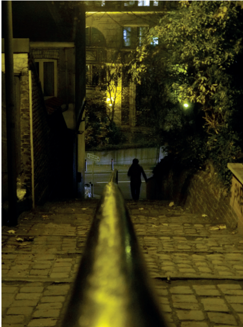
Edouard BILLE Lycée Émile Jacqmain Oud straatje, Oudergem