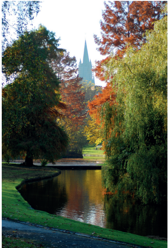
Marion KÖIV École européenne de Bruxelles 2 Leybeekvijvers, Watermaal-Bosvoorde