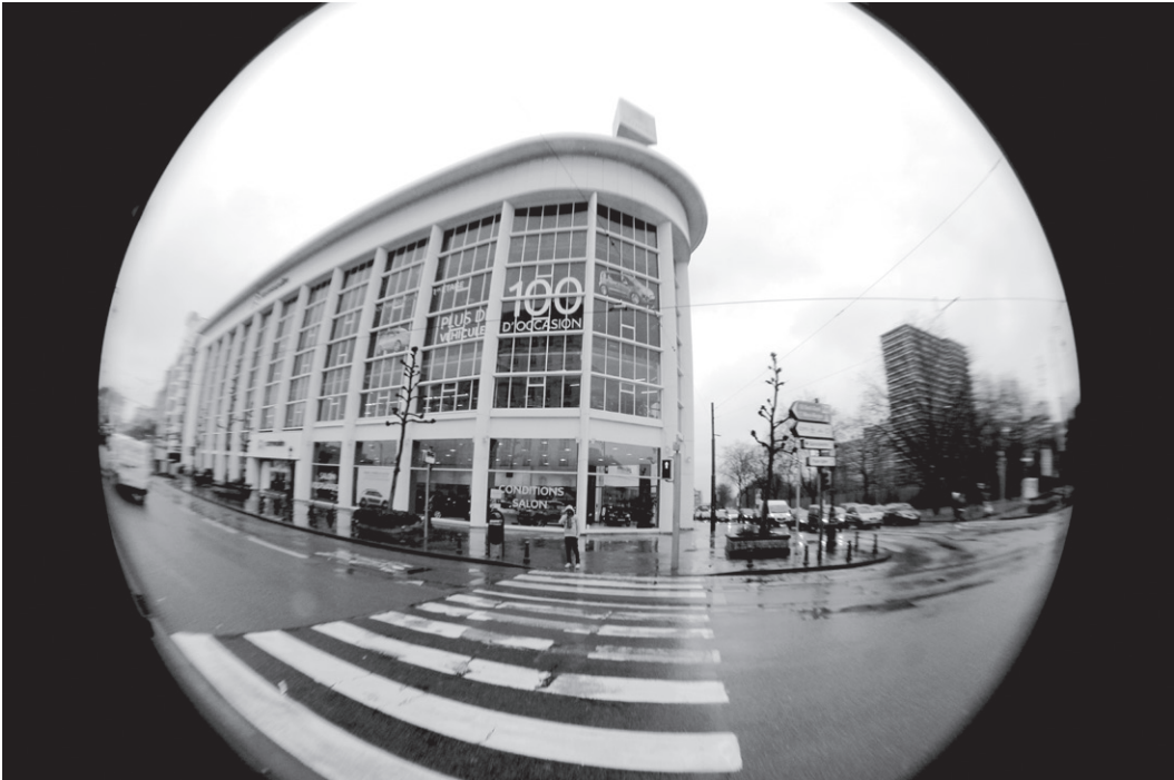
Zoé QUERTIGNIEZ École Decroly Garage Citroën, Brussel