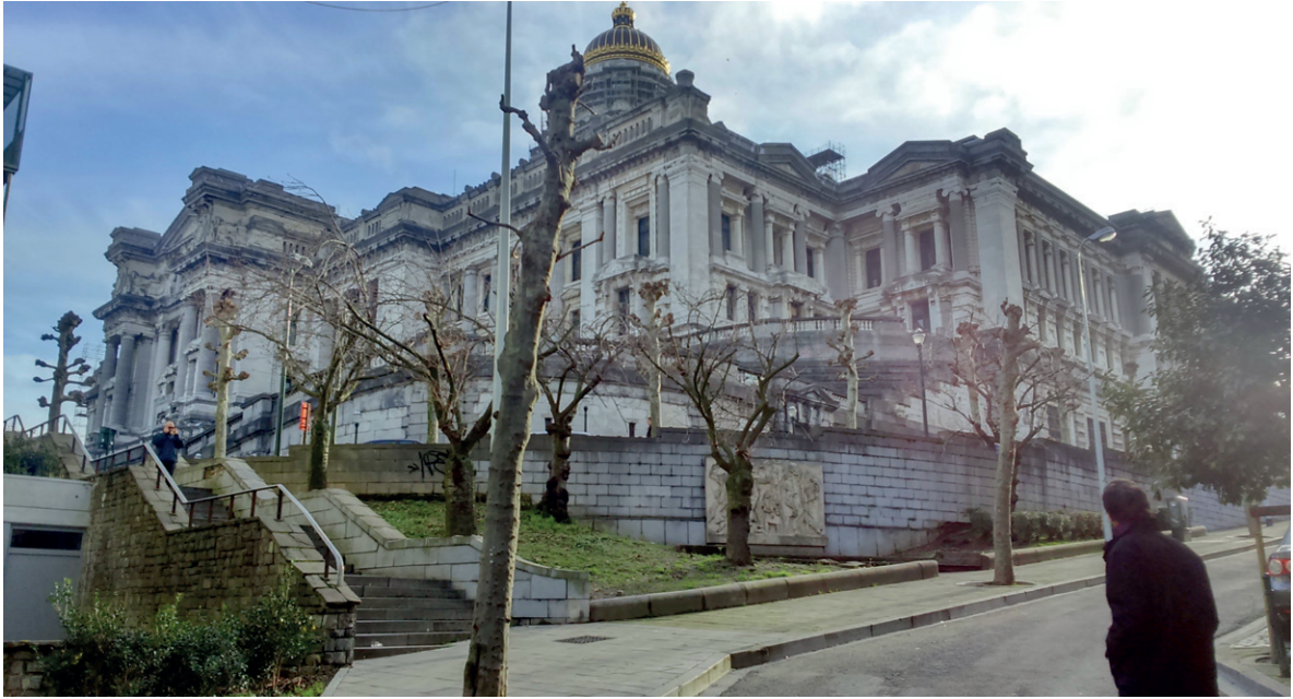
Sephora KARTAL Athénée royal de Ganshoren Justitiepaleis, Brussel