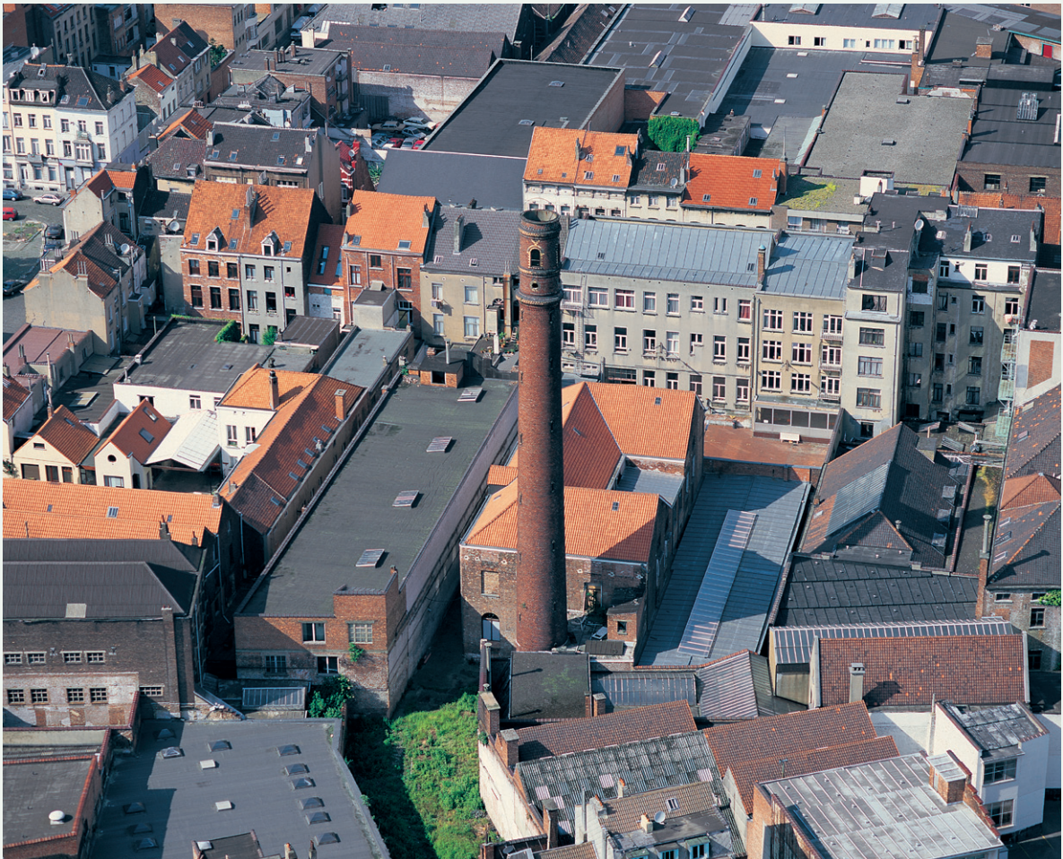
De Loodtoren in Brussel.

KUNSTHISTORICA, DIRECTIE MONUMENTEN EN LANDSCHAPPEN