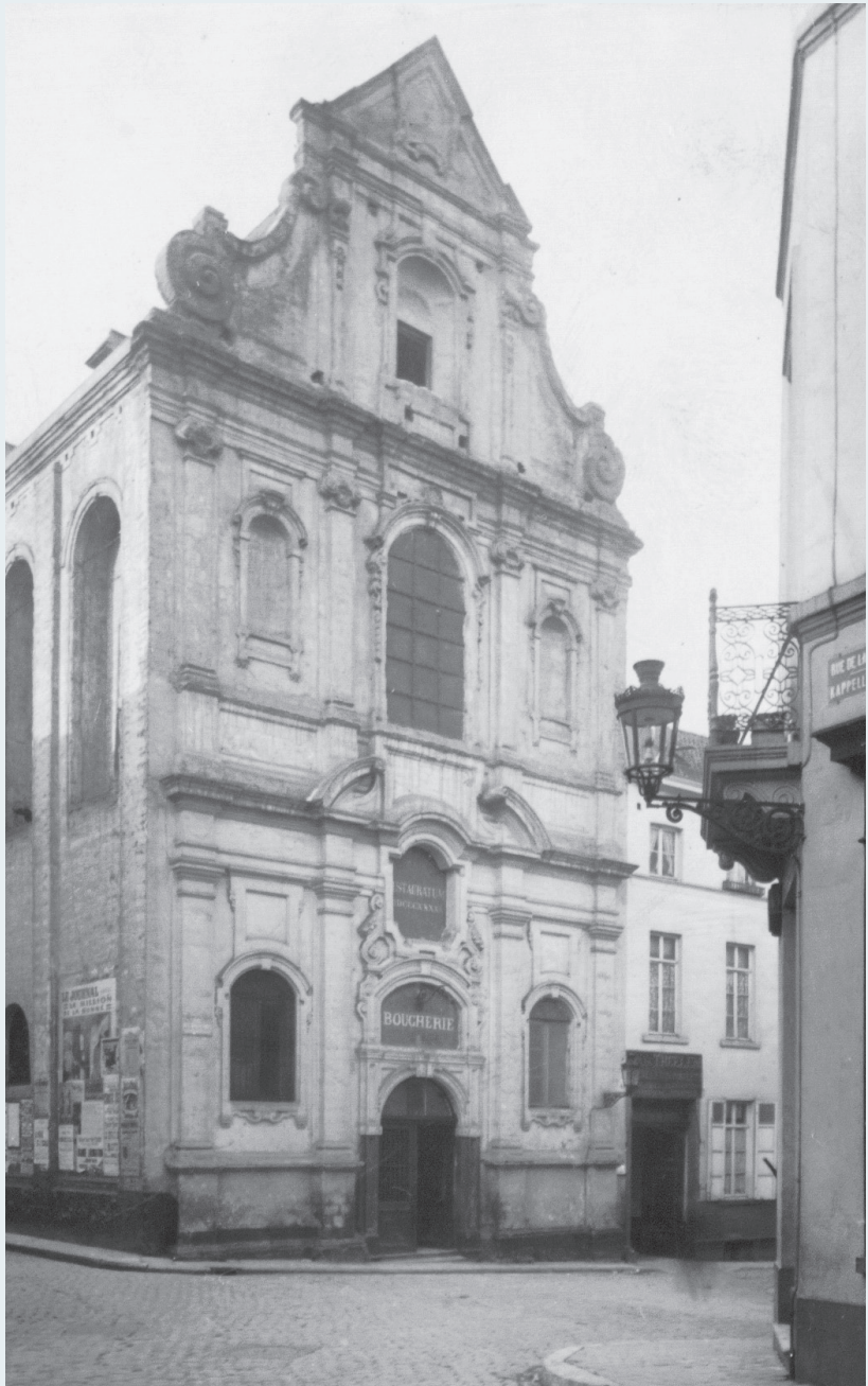
Brigittinerkerk, omstreeks 1900, toen er in de kerk een slagerij gevestigd was.

HISTORICUS, ATTACHÉ BIJ DE KONINKLIJKE MUSEA VOOR KUNST EN GESCHIEDENIS, OPDRACHTHOUDER BIJ DE DIRECTIE MONUMENTEN EN LANDSCHAPPEN