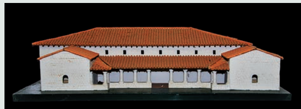
De maquette van de villa.