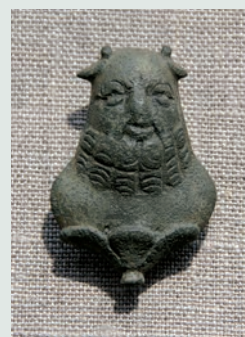
Bronzen woudegeest (© Graafschap Jette - Comté de Jette).