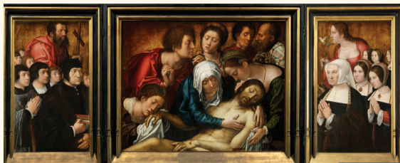
Triptyque Haneton, début des années 1520 Hanetontriptyek, begin van de jaren 1520