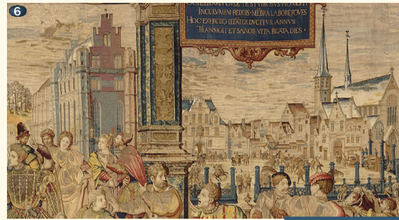
Le mois de février (Chasses de Charles Quint) détail, vers 1530 (© RMN) De maand februari (Jachten van Keizer Karel) détail, omstreeks 1530 (© RMN)