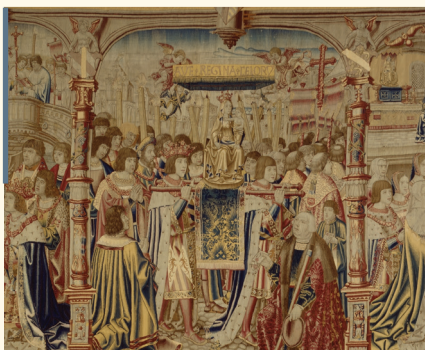
Détail d'une des tapisseries de Notre-Dame du Sablon, vers 1516 Detail van een van de wandtapijten van Onze-Lieve-Vrouw van de Zavel, omstreeks 1516