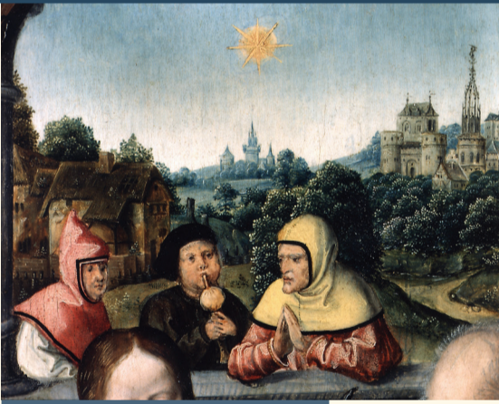
Polyptyque de la vie et de la mort de la Vierge (détail), 1520 (© MCPASB) Polyptiek van het leven en de dood van de Maagd (detail), 1520 (© MOCMWB)

En 1517, Van Orley a peut-être l'occasion de voir les cartons des Actes des Apôtres – peints par Raphaël – dans un atelier de la rue du Marché au Charbon où ils se trouvent pour réaliser des tapisseries destinées à la chapelle Sixtine. Sur la Grand-Place, Le Pigeon (n os 26-27) est alors occupé par le métier des peintres dont un des fils de Van Orley, Jérôme, sera le doyen. Le métier des tapisseries investit quant à lui la Maison de l'Arbre d'Or (n o 10) qui deviendra ensuite la Maison des Brasseurs . La Maison du Roi (V. Jamaer, 1873) abrite aujourd'hui le Musée de la Ville de Bruxelles où est exposé le carton de La Décollation de saint Paul (ca 1530) par Pieter Coecke van Aelst, attribué autrefois à Van Orley.