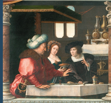
Maison de Van Orley ? Polyptyque de Job et de Lazare (détail), 1521 (© MRBAB) Huis van Van Orley ? Polyptiek van Job en Lazarus (detail), 1521 (© KMSKB)

L'île aux artistes Het kunstenaarseiland