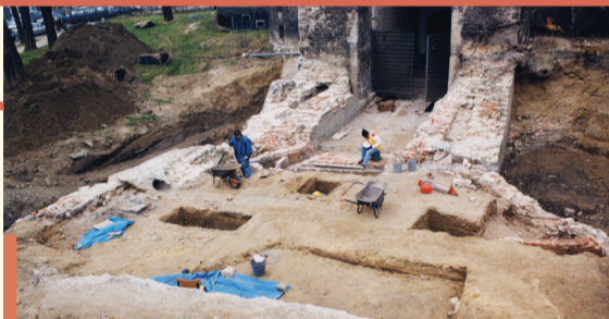
Fouille du pont dormant / Opgraving van de vaste brug, 1998

L a porte de Hal est le seul vestige important de la deuxième enceinte. Elle est épargnée au moment de la destruction du rempart parce qu'elle est utilisée comme prison. Lorsque le bâtiment accueille le Musée royal des Armes et Armures, il est restauré en un prestigieux monument néogothique par l'architecte Henry Beyaert. Entre 1991 et 2008, le bâtiment fait l'objet de plusieurs campagnes de restauration couplées à des recherches archéologiques. Aujourd'hui, la porte de Hal offre aux visiteurs une présentation interactive axée sur les remparts et le rôle des guildes. Elle accueille aussi des expositions temporaires.