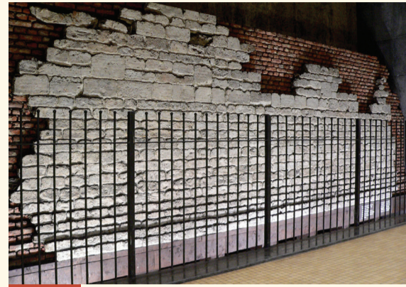
Station de métro Hôtel des monnaies Metrostation Munthof

M ême détruite, la deuxième enceinte a laissé une marque considérable dans la ville d'aujourd'hui. La petite ceinture actuelle suit en effet le tracé de l'ancien rempart. Au XIX e siècle, ces boulevards sont de modernes voies arborées, bordées de grandes maisons de maître et de commerces de luxe. Ils sont alors destinés à la promenade mondaine et rapidement parcourus par un réseau de trams. Bientôt, les arbres disparaissent du paysage et les piétons sont relégués sur les trottoirs pour laisser place aux voitures. Dès 1957, des tunnels sont creusés pour les voitures puis pour le métro.