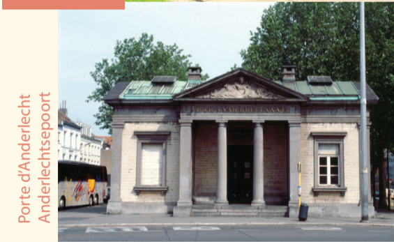
Porte d'Anderlecht Anderlechtspoort