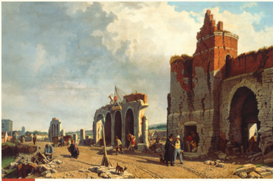
Démolition de l'enceinte (XIX e s.) Afbraak van de omwalling (19de e.)

Dans un premier temps, quelques portes de l'enceinte seront démolies et la haute muraille deviendra, par endroits, un lieu de promenade très apprécié offrant une magnifique vue panoramique. En 1810, Napoléon donnera l'ordre de faire totalement disparaître l'enceinte pour la remplacer par de larges boulevards.