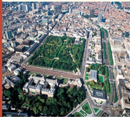
La petite ceinture à hauteur du parc Royal / De kleine ring ter hoogte van het Warandepark

H oewel de tweede omwalling werd vernietigd, heeft ze een duidelijke stempel gedrukt op de hedendaagse stad. De kleine ring volgt immers het tracé van de oude stadsmuur. In de 19de eeuw waren deze ringlanen moderne, met bomen omgeven wegen, waar grote herenhuizen en luxe handelspanden gelegen waren. Ze werden toen vooral gebruikt als mondaine wandelplaats en werden al snel voorzien van tramlijnen. Daarna verdwenen de bomen uit het landschap en werden de voetgangers naar de voetpaden verbannen om plaats te maken voor auto's. Vanaf 1957 worden, eerst voor de auto's en nadien ook voor de metro, tunnels aangelegd.