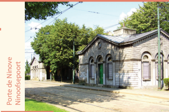
Porte de Ninove Ninovepoort

D ès leur création, les boulevards sont longés par une barrière qui clôture encore la ville. Elle ne joue plus de fonction défensive mais elle impose toujours d'accéder à la ville par des portes. Au nombre de 14 et marquées par des pavillons néoclassiques, ces portes sont le lieu de perception de l'octroi, taxe sur les marchandises. Lorsque l'octroi est aboli en 1860, les grilles sont détruites à grand fracas par une population euphorique. Aujourd'hui, les pavillons d'octroi de la porte d'Anderlecht et de Ninove sont toujours présents. Ceux de la porte de Namur ont été déplacés à l'entrée du bois de la Cambre, au bout de l'avenue Louise.