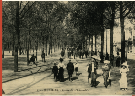
Avenue de la Toison d'Or début XX e s. Guldenvlieslaan begin 20ste e.

D e evolutie in de oorlogsvoering zorgde ervoor dat stadsversterkingen vanaf de 18de eeuw nutteloos werden. De hoge stenen muren verstikten de steeds groeiende bevolking. Daarenboven zorgden ze voor een te belangrijke scheiding tussen de stad en het omliggende platteland. In eerste instantie werden enkele stadspoorten afgebroken, en veranderde de hoge stadsmuur, op bepaalde plaatsen, in een gegeerde wandelplaats die een prachtig panoramisch zicht bood. In 1810, gaf Napoleon tenslotte het bevel om de omwalling helemaal af te breken en ze te vervangen door brede lanen.