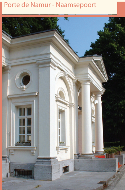
Porte de Namur - Naamsepoort

B ij de aanleg van de ringlanen werd de stad nog steeds afgesloten van het omliggende platteland door een muur. Zij speelde geen defensieve rol meer, maar zorgde ervoor dat de toegang tot de stad nog steeds moest gebeuren via toegangspoorten. Er waren 14 toegangspoorten en deze werden aangeduid met paviljoentjes in neoklassieke stijl. Daar werd het octrooi, de tol op goederen, geïnd. Toen het octrooirecht in 1860 werd afgeschaft, werd de muur door de euforische bevolking met veel kabaal vernietigd. De octrooipaviljoenen van de Anderlechtse- en de Ninovepoort bestaan vandaag nog steeds. De paviljoentjes van de Naamsepoort werden verplaatst naar de ingang van het Terkamerenbos, gelegen aan het einde van de Louisalaan.