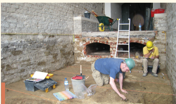
Fouille de la fosse du pont levé / Opgraving van de binnengracht van de ophaalbrug, 2007