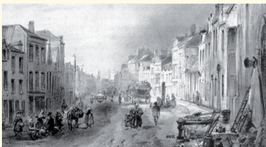
XIX e siècle - 19e eeuw Aujourd'hui - Vandaag

Depuis le XIII e siècle, l'artère principale du quartier constitue l'ancienne voie d'accès à la ville par le sud. À partir du XIX e siècle, la rue et ses abords immédiats rassemblent une population ouvrière nombreuse confinée dans quelque trente-cinq impasses dont subsistent encore plusieurs traces, par exemple au niveau l'impasse de Varsovie (n° 188). Au sud s'étire le vaste complexe de l'hôpital Saint-Pierre qui est d'abord occupé par une léproserie (XII e s.) puis par un couvent (XVIII e s.). La rue compte plusieurs demeures traditionnelles (XVI e -XVIII e s.) avec façades à pignons, comme le n° 132, maison ayant appartenu à la famille du peintre Pierre Bruegel (v. 1525-1569), restaurée par A. Hannaert en 1963.