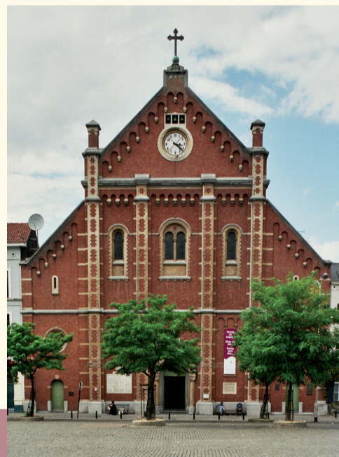
Église de l'Immaculée Conception Kerk van Onze-Lieve-Vrouw Onbevlekt

Achevée en 1863, en même temps que la rue Blaes qui la longe du côté oriental, elle doit son nom au jeu de balle pelote qui s'y pratiquait dès sa création. Le « vieux marché » de la place Anneessens y est transféré en 1873. L'ancienne caserne des pompiers, construite sur les plans de J. Poelaert en 1859-1860, domine la partie est tandis que l'église de l'Immaculée Conception (1852) borde la partie ouest. À l'angle de la rue du Chevreuil (n° 28), les Bains de Bruxelles sont édifiés en 1951 par M. Van Nieuwenhuysse en remplacement de l'établissement de douches publiques de 1904 qui occupait le centre de la place. L'ambiance de cette dernière est assurée par le marché aux puces quotidien et de nombreux cafés.