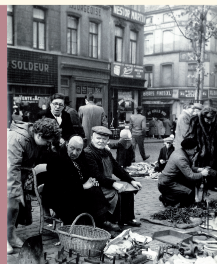
Le marché aux puces De vlooiemarkt