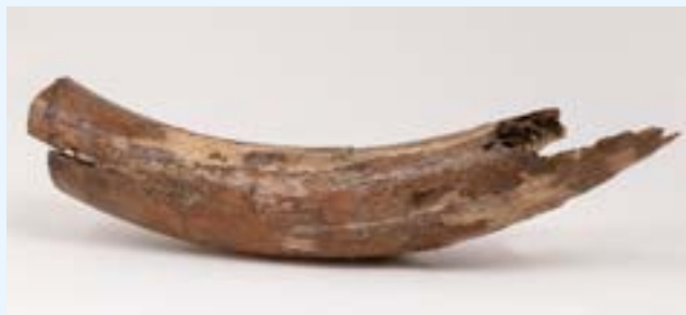
FIG. 8 Fragment de défense de mammouth datant d'il y a au moins 150.000 ans. Découvert dans une ancienne zone d'alluvions de la Senne, rue Quatrecht, à Schaerbeek en 2018.