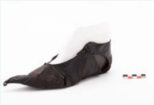
FIG. 5 Chaussure à poulaine gauche en peau de chèvre (XV e siècle). Découverte Parking 58, rue des Halles en 2019.