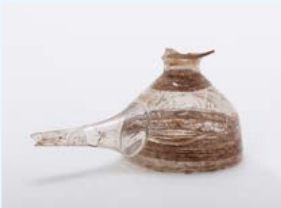
FIG. 7 Tire-lait en verre datant du 18 e siècle. Lieu de découverte: couvent des Pauvres-Claires, rue de Laeken, Bruxelles.