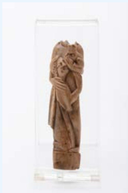
FIG. 4 Manche de couteau en os orné d'une scène évoquant la loyauté conjugale (1400-1525). Lieu de découverte: Parc Simone de Beauvoir (parc de Fontainas), Bruxelles.