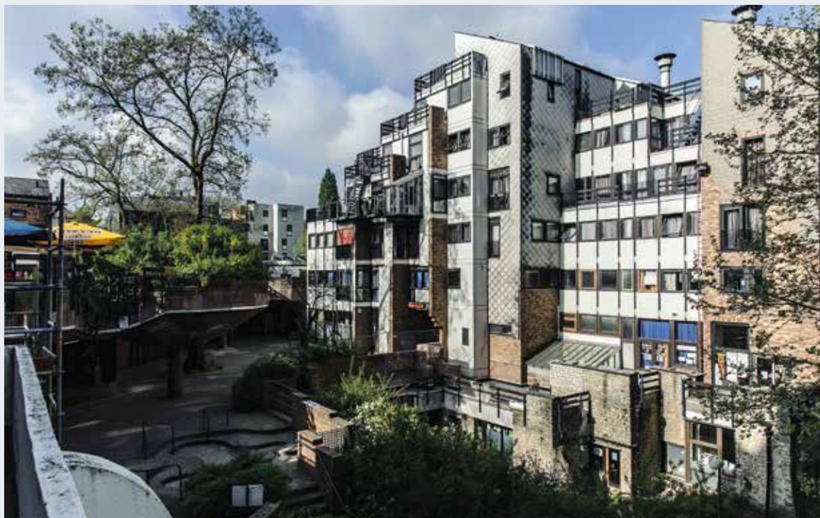
La MéMé, Atelier Simone et Lucien Kroll (1969 -1976).

ARCHITECTE, SECRÉTAIRE DE LA COMMISSION ROYALE DES MONUMENTS ET DES SITES, DIRECTION DES MONUMENTS ET SITES