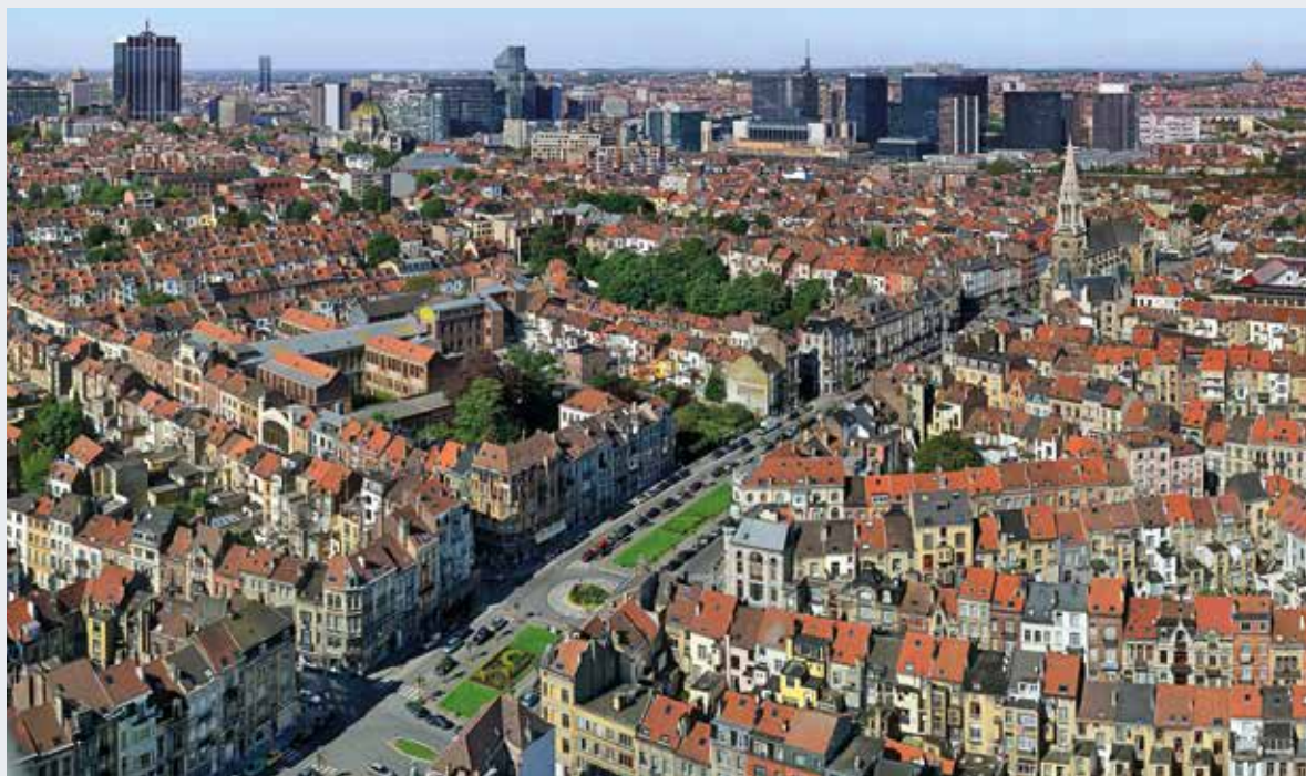
L'avenue Louis Bertrand à Schaerbeek (© J. de Selliers, 2012).

En avril 2017, la CRMS a demandé le classement de l'avenue Louis Bertrand à Schaerbeek. Aménagé de 1904 à 1913, cet axe compte parmi les plus belles réussites urbanistiques de l'époque. Marquée par sa largeur, sa courbe, son évasement et son ample perspective en éventail vers le parc Josaphat, dont elle constitue le prolongement, il s'agit d'une des plus majestueuses artères de la région bruxelloise. Vitrine architecturale où se côtoyaient styles éclectique et Art nouveau, ses qualités historiques, paysagères et urbanistiques, bien préservées jusqu'ici, lui confèrent un statut de patrimoine urbain majeur à l'échelle régionale.