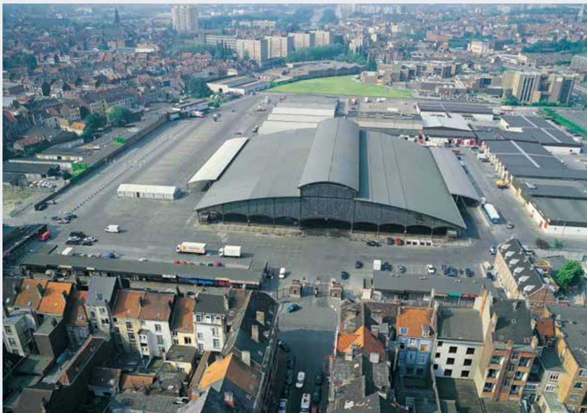
Le marché aux bestiaux couvert de Cureghem à Anderlecht.

En mai 2017, la CRMS s'est prononcée favorablement sur le principe de placement de films solaires sur les toitures de la grande halle classée comme monument en 1988. Le caractère souple et mince des films permet d'épouser les formes et profils sans surépaisseur visible. Le ton sombre et une mise en œuvre dans le respect des ordonnancements architecturaux et des répartitions originelles des bandes de zinc, permettra une intégration harmonieuse dans le paysage. L'occasion est ainsi donnée d'allier, au sein d'un même projet cohérent, enjeux patrimoniaux et énergétiques. Développant de grandes surfaces libres et uniformes, la typologie des toitures des abattoirs et leur contexte urbain, se prêtent spécifiquement bien à l'exercice.