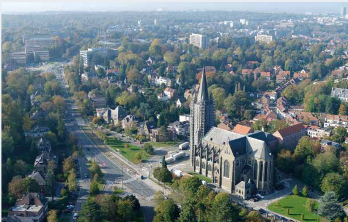
L'église Saint-Hubert à Watermael-Boitsfort.

En mai 2018, la CRMS a rendu un avis défavorable sur le permis d'urbanisme visant la réhabilitation de l'église Saint-Hubert (non protégée) à Watermael-Boitsfort en équipements collectifs, logements et maintien d'un lieu de culte. La CRMS a recommandé de revoir profondément le projet en vue d'un plus juste équilibre entre les spécificités de l'ancien édifice religieux et la densité des nouvelles affectations afin de définir une conduite d'intervention à la hauteur du lieu et de sa présence urbanistique. L'église Saint-Hubert sera la première église à bénéficier d'une réhabilitation en logements d'une telle envergure en région bruxelloise.