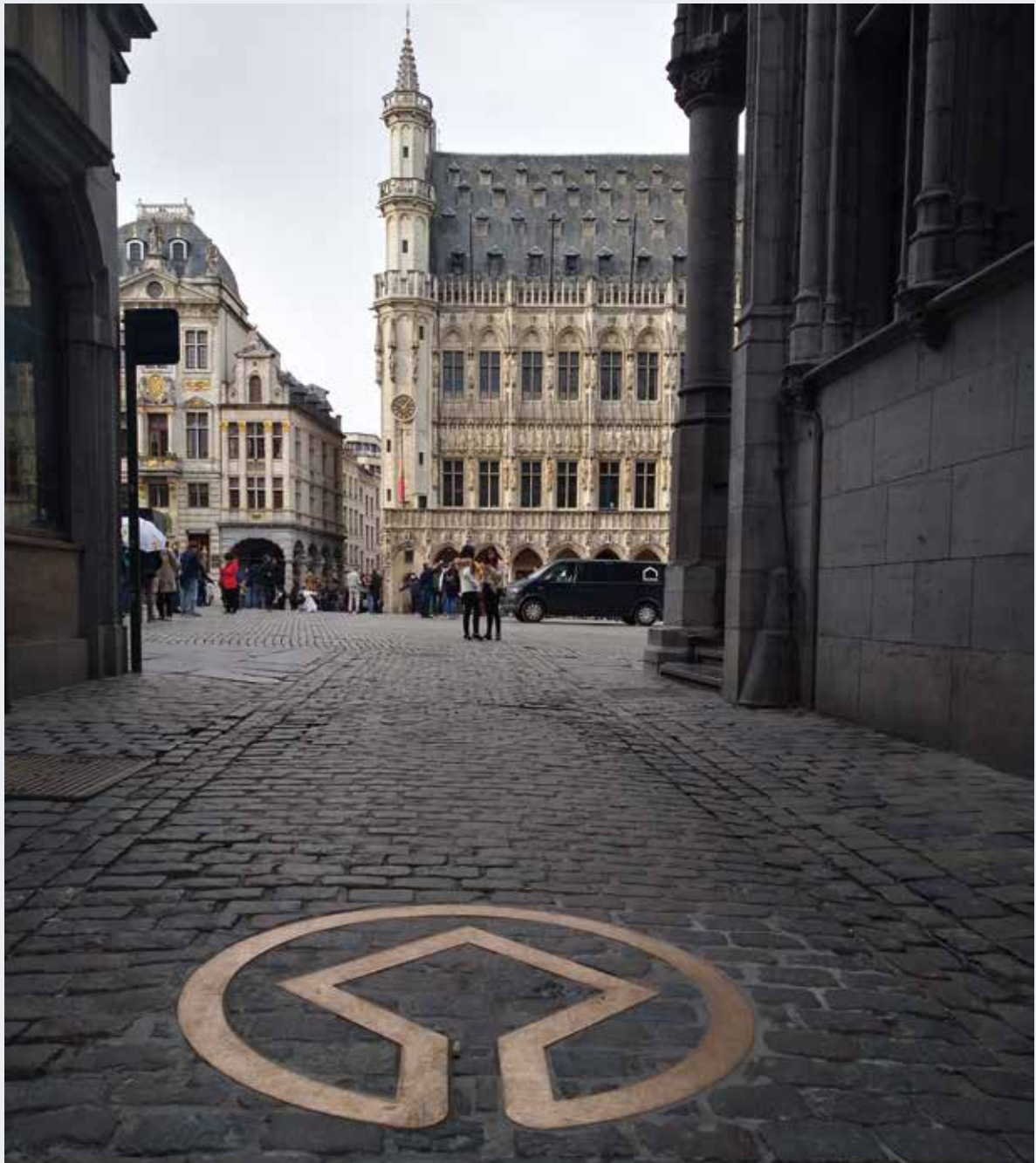
Logo UNESCO inséré dans les pavés de la rue des Harengs à l'entrée de la Grand-Place

HISTORIENNE DE L'ART, DIRECTION DES MONUMENTS ET SITES POINT FOCAL UNESCO - RÉGION DE BRUXELLES-CAPITALE