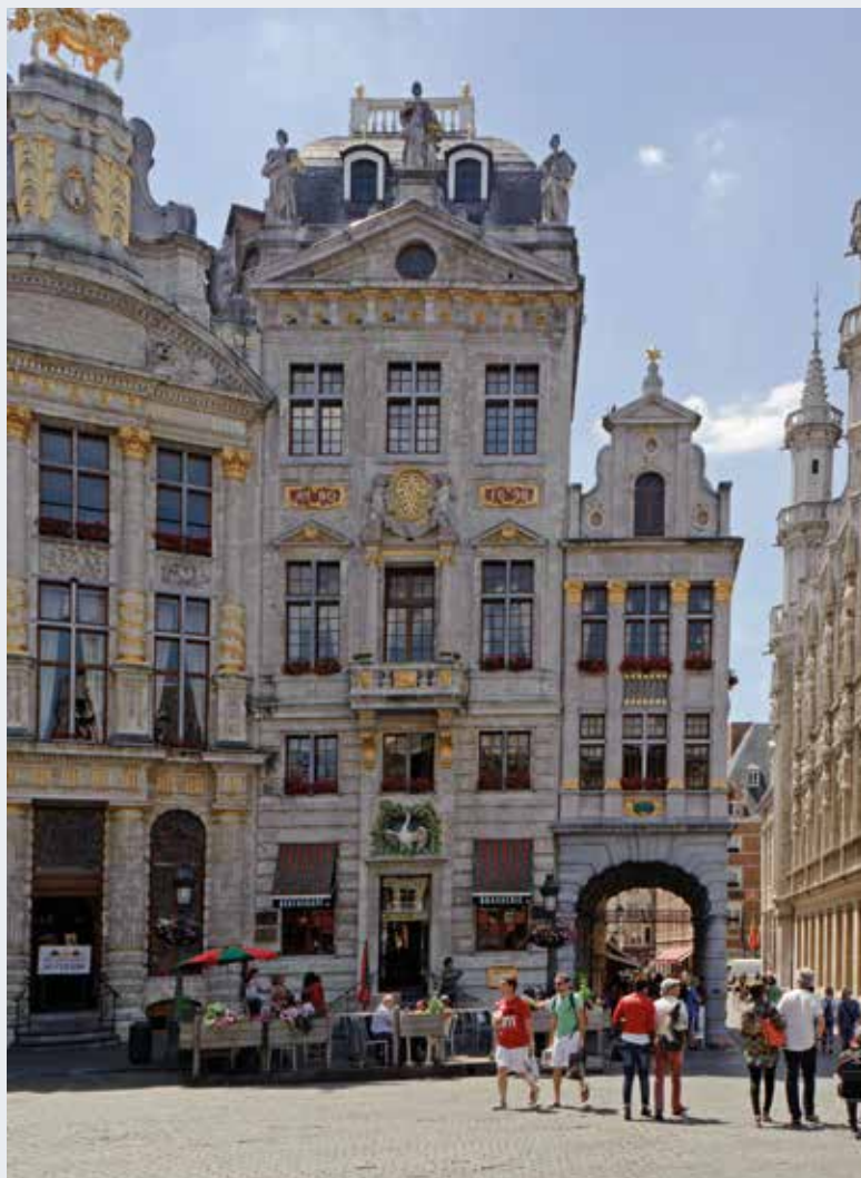
Les Maisons Le Cygne et l'Étoile après leur restauration en 2014.