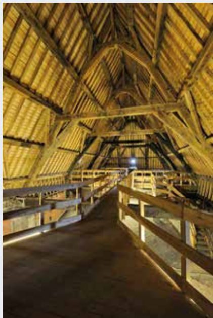
Fig. 5 La charpente de l'église du Béguinage photographiée à la fin du chantier de reconstruction-reconstitution en 2008.