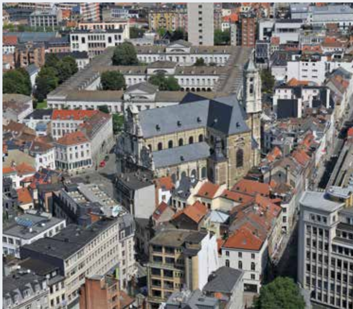
Fig. 6 L'église du Béguinage dans son environnement urbain (W. Robberechts © BUP/BSE).

moniaux, les sites, l'urbanisation d'un quartier ainsi que les monuments d'envergure et leur empreinte sur le tissu urbain. La collection Schmitt-GlobalView centrée sur les communes périphériques de l'agglomération est complémentaire à celle de Robberechts, qui concerne principalement le centre-ville (fig. 6).