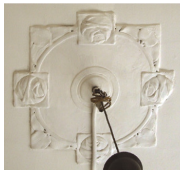
Fig. 7 Moultures du plafond, rue du Lombard 5-7, 1908-1909.

Ses premières habitations se reconnaissent à la géométrisation des éléments décoratifs (enroulements et volutes, grilles, dessins de la pierre bleue, boiseries, amortissement des pilastres), aux cercles, oves et triples rainures. Des frises