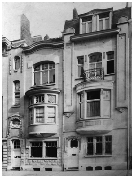
Fig. 10 Rue de la Jonction, 12-14, 1909-1910. Photographie non datée.

manditaire, il se voit confier plusieurs gros chantiers de transformation de salles polyvalentes et de cinéma. Il fait ses premières armes, en 1908, pour le Théâtre Pathé situé boulevard du Nord, qu'il agrandit, en 1910 et 1912, d'un magasin d'appareils de projection Pathé-Kok . Suit une série de commandes de salles, comme le Théâtre des Variétés en 1909, ou le Select Pathé , avenue de la Toison d'Or en 1911.