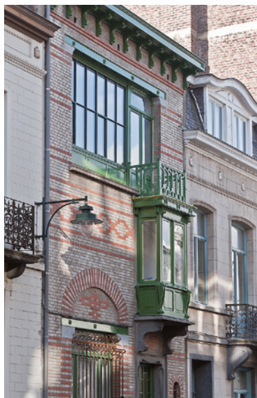
Fig. 2 Maison-atelier d'Arthur Rogiers, rue Charles Quint 103, Bruxelles. 1898. Première réalisation connue de Paul Hamesse.

Ils seront ses trois seuls collaborateurs. Très marqué par la personnalité de Hankar, Hamesse écrit son éloge funèbre et lui dessine un projet de monument funéraire, qui ne se concrétisera jamais (fig. 1) 9 .