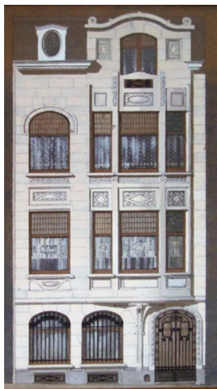
Fig. 8 Hôtel particulier, rue Franz Merjay 197, Ixelles, 1910. Dessin de la façade avant (archives familiales Hamesse).