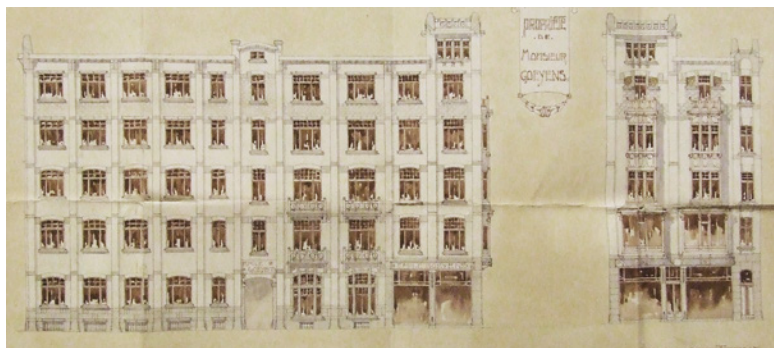
Fig. 6 Anciennes Usines Émile Goeyens, rues des Fabriques et Notre-Dame du Sommeil, 1909. Élévations des façades projetées rue des Fabriques et place du Jardin aux Fleurs, 1909.