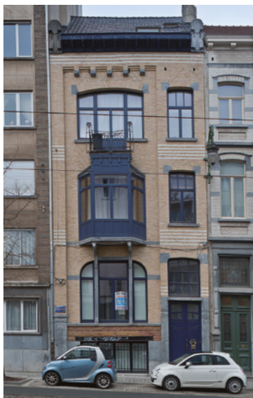
Fig. 3 Maison-atelier de Paul Verdussen, avenue Brugmann 211, Ixelles. 1901. Troisième réalisation connue de Paul Hamesse.

Paul participe avec son frère Georges à la revue artistique La Gerbe , qui rassemble des artistes et architectes novateurs pour leur temps. De cette revue ne paraissent que sept numéros, en 1898 et 1899. Hamesse y rédige plusieurs articles, dont des comptes-rendus d'expositions de peintures, sous son propre nom ou sous le pseudonyme de Polam. On y sent un jeune architecte passionné d'art sous toutes ses formes et bien introduit dans le milieu artistique bruxellois, avec lequel il entretient des liens étroits. Pendant son stage chez Hankar, Paul participe en effet à la réalisation de plusieurs ateliers d'artistes, notamment ceux de Jean Gouweloos, Léon Bartholomé et René Janssens, membres du cercle artistique Le Sillon dont Hankar fait partie,