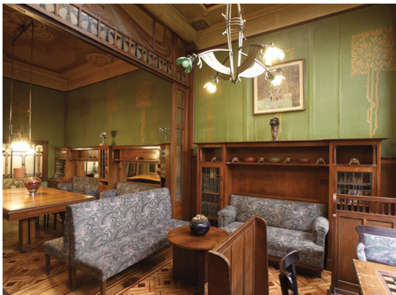
Fig. 4 Hôtel Cohn-Donnay, rue Royale 316, Saint-Josse-ten-Noode, 1904.