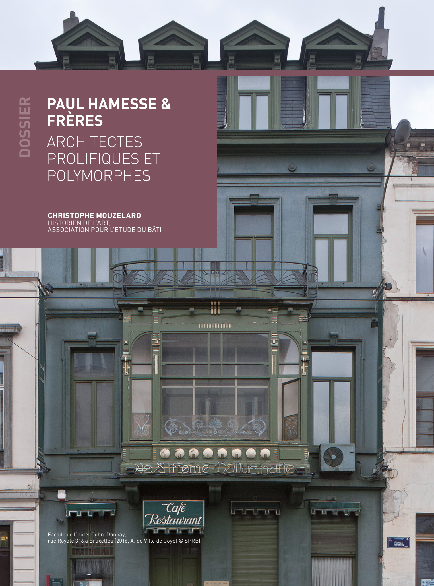
Façade de l'hôtel Cohn-Donnay, rue Royale 316 à Bruxelles (2016, A. de Ville de Goyet © SPRB).

CHRISTOPHE MOUZELARD HISTORIEN DE L'ART, ASSOCIATION POUR L'ÉTUDE DU BÂTI