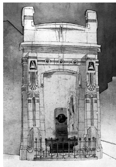
Fig. 1 Projet de monument commémoratif dédié à Paul Hankar, 1902.

Georges, l'aîné, suit les cours de l'atelier de Peinture monumentale de Constant Montald à l'Académie royale des Beaux-Arts de Bruxelles 4 . Il y est également formé à la peinture d'après nature de 1895 à 1897 5 . Élève à l'École des Arts industriels et décoratifs d'Ixelles, il obtient le premier prix du cours supérieur de dessin pour l'année 1897-1898 6 . Georges se lance ensuite comme photographe d'art. Son atelier se trouve rue Jean Stas 4, de 1902 à 1906 au moins 7 . Léon, le cadet des frères, suit une formation de peintre à l'Académie royale des Beaux-Arts de Bruxelles, suivant les traces de son père et de son frère aîné.