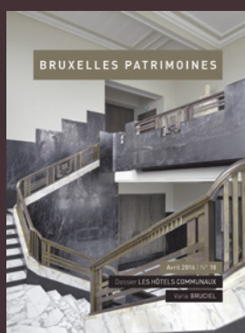
018 - Avril 2016 Les hôtels communaux