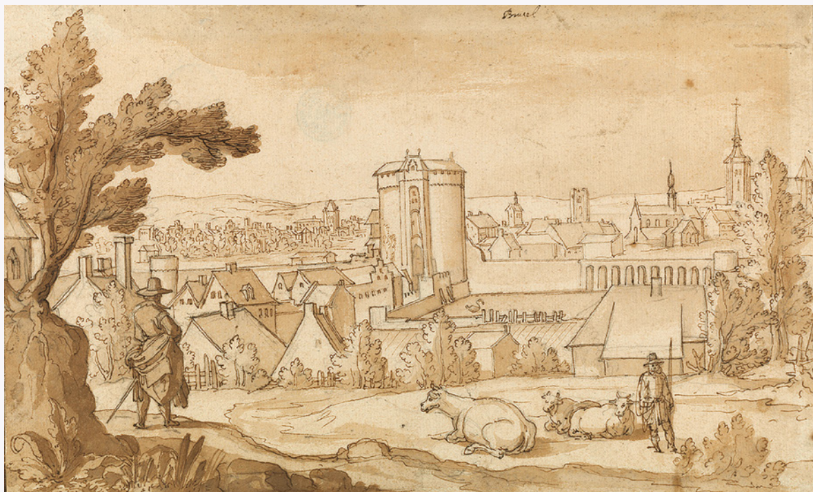
Panorama de Bruxelles depuis Saint-Gilles, avec la porte de Hal au centre.

HISTORIEN, ATTACHÉ AUX MUSÉES ROYAUX D'ART ET D'HISTOIRE, CHARGÉ DE MISSION AUPRÈS DE LA DIRECTION DES MONUMENTS ET SITES