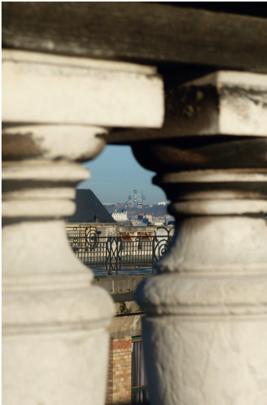
Thanh RODIERS École professionnelle Edmond Peeters Vue depuis la place Poelaert, Bruxelles