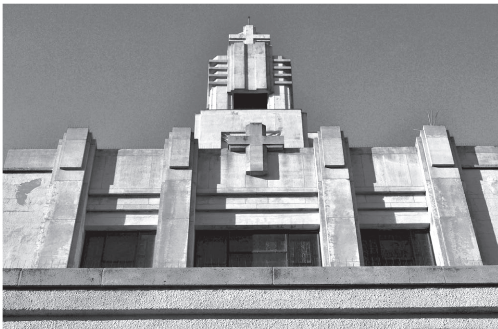
Maya GOLDBERG École Decroly Église Saint-Augustin, Forest