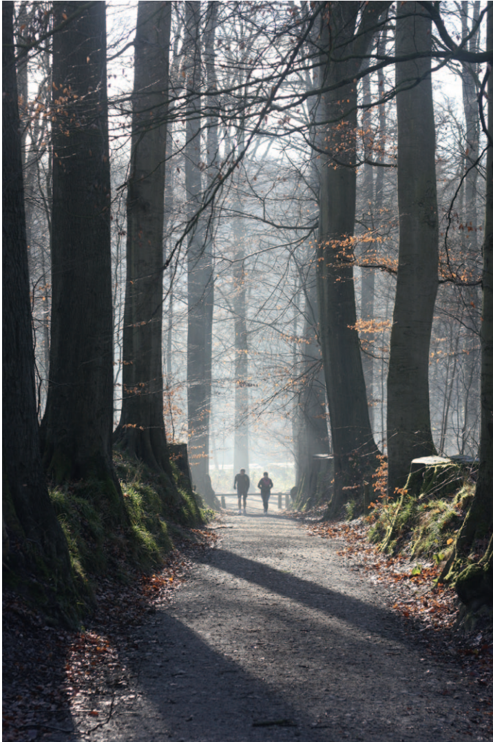
Maxime PLEINEVAUX Institut Saint-Dominique Forêt de Soignes