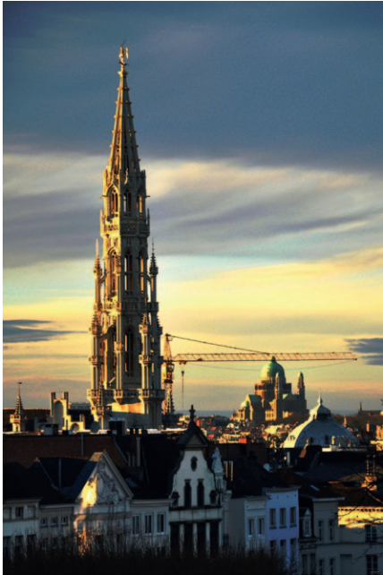
Théo COLLIGNON École Decroly Vue sur l'hôtel de ville de Bruxelles