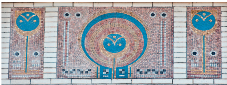
▲ Afb. 7b

In 2007 werd een bijzonder interessante kliniek beschermd: het voormalige Institut pour le traitement des maladies des yeux 6 . Deze privékliniek aan de Tervurenlaan 68-72 in Etterbeek werd tussen 1912 en 1914 gebouwd voor dokter Henri Coppez. De dokter koos voor zijn kliniek een prestigieuze, boomrijke laan én hij deed een beroep op een van de meest ervaren architecten in de ziekenhuisbouw: Jean-Baptiste Dewin. De kliniek is omheind