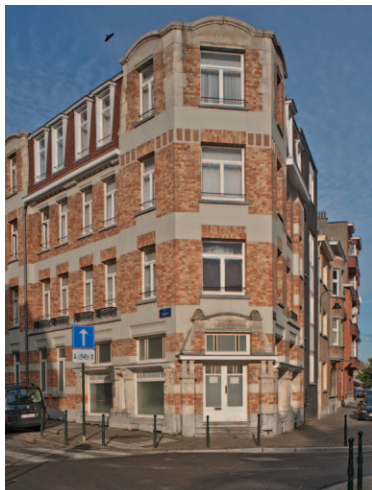
▲ Afb. 2a

Woningcomplex Fransmanstraat 94 (hoek van Fineastraat), Brussel-Laken.