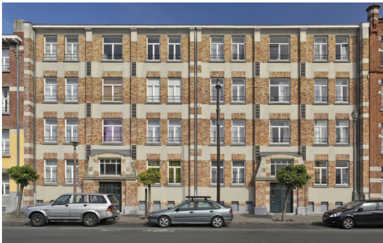
▼ Afb. 2b

Woningcomplex Fransmanstraat 94 (hoek van Fineastraat), Brussel-Laken (A. de Ville de Goyet, 2014 © GOB).