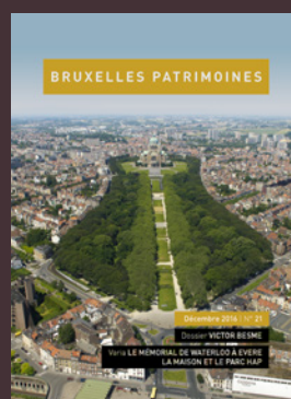
021 - December 2016 Victor Besme