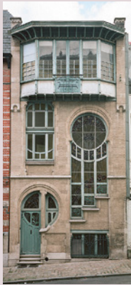
13 ▼ [M. Litt © GOB].