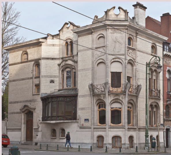
2 ▼ (A. de Ville de Goyet, 2016 © GOB).