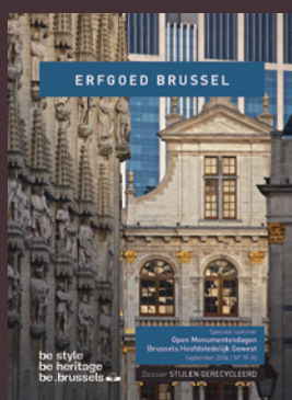
019-020 - September 2016 Stijlen gerecycleerd