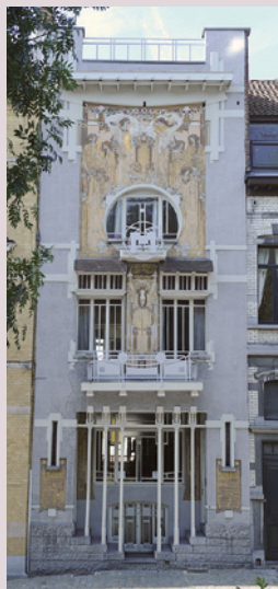
1 ▼ (M. Vanhulst, 2012 © GOB).