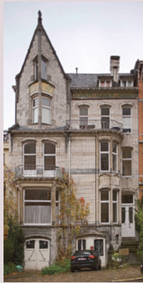
12 ▼ [A. de Ville de Goyet, 2010 © GOB].