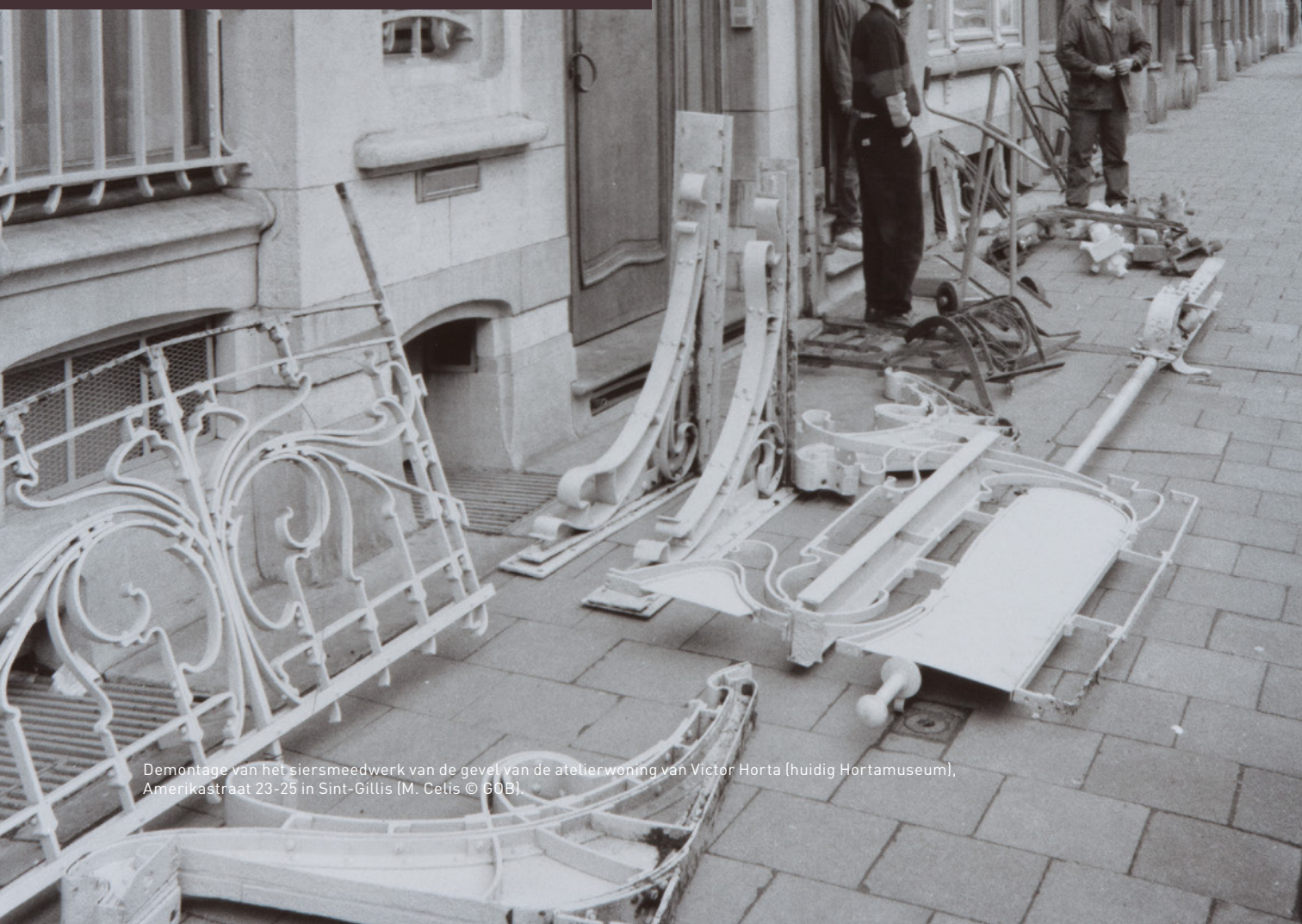
Demontage van het siersmeedwerk van de gevel van de atelierwoning van Victor Horta (huidig Hortamuseum), Amerikastraat 23-25 in Sint-Gillis.

MURIEL MURET KUNSTHISTORICA, DIRECTIE MONUMENTEN EN LANDSCHAPPEN