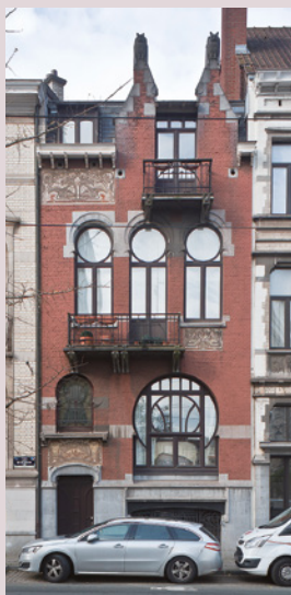
6 ▼ [A. de Ville de Goyet, 2016 © GOB].